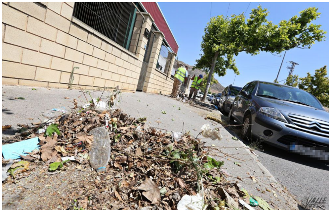
Desde el Ayuntamiento admiten que es una zona en la que se necesita actuar