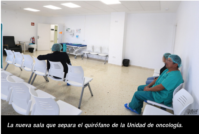
La nueva sala que separa el quirófano de la Unidad de oncología.

En el Hospital de Día son conscientes de la situación y están valorando introducir algunos cambios en los próximos meses para evitar esperar, ya que todo depende de la coordinación entre los profesionales.