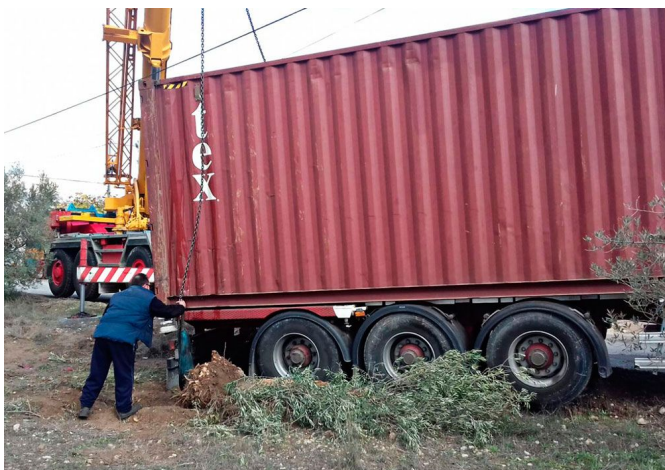
El camión quedó atrapado en la tierra.