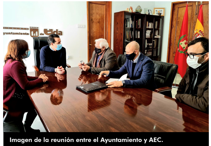
Imagen de la reunión entre el Ayuntamiento y AEC.

municipal de Elda y estén asociadas a la Asociación Española de Empresas Componentes para el Calzado podrán percibir parte de la subvención que consistirá en un máximo del 25% del coste del expositor.