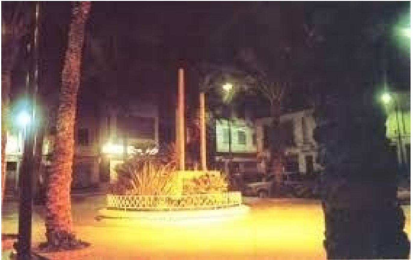
Monumento a la industria del Calzado ofrecido en el año 1972.

El prestigio de los pueblos se adquiere por diferentes motivos: su pasado histórico, su empuje económico como consecuencia de una industria puntera, su cultura, la monumentalidad de su casco antiguo e incluso por la importancia histórica de personaje que nacieron o vivieron en esas ciudades. Sin embargo ese mismo prestigio que cuesta décadas conseguir y con muchísimo esfuerzo, se suele perder todo o parte por acciones irreflexivas llevadas a cabo en un determinado periodo, sin el menor atisbo de respeto o agradecimiento a los que propiciaron hechos significativos en momentos de esplendor.