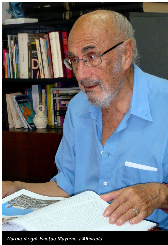
García dirigió Fiestas Mayores y Alborada .

Hombre culto y sensible, consiguió que estas revistas adquiriesen cada vez mayor calidad, y sus editoriales eran esperadas. Uno de los hechos de los que se sentía especialmente orgulloso fue la obtención del Premio Provincial a la mejor revista del año 1976. También consideraba un hecho destacable conseguir la omisión desde el primer momento de las referencias al Jefe del Estado y demás autoridades políticas en las páginas de la revista, como era costumbre en este tipo de publicaciones.