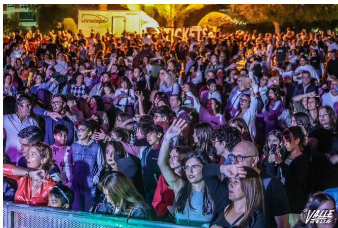
Miles de personas acudieron al céntrico jardín