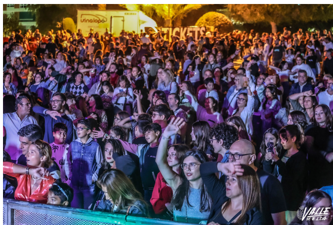
Miles de personas acudieron al céntrico jardín