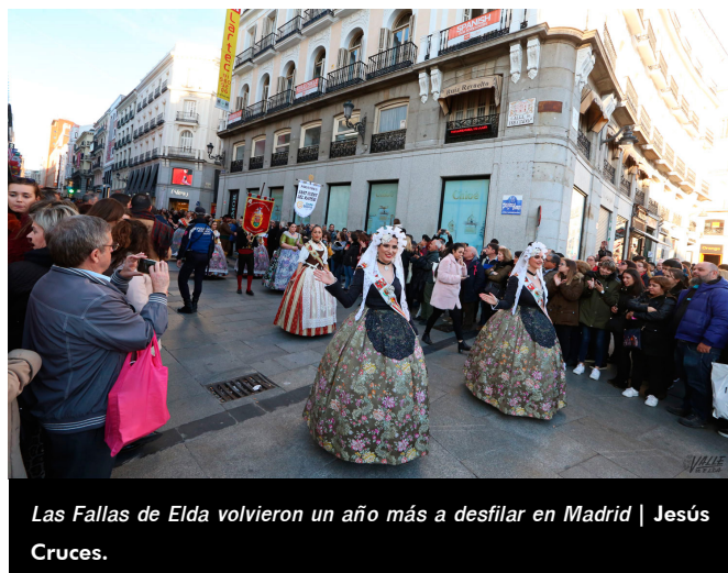
Las Fallas de Elda volvieron un año más a desfilar en Madrid

Las festeras arrancaron los aplausos del público madrileño durante todo el recorrido. Los turistas extranjeros también alabaron el desfile y lo más significativo fueron las decenas de eldenses afincados en la capital de España que no dudaron en revivir sus fiestas y acompañar a las delegaciones como espectadores, animando con energía al paso de las escuadras.