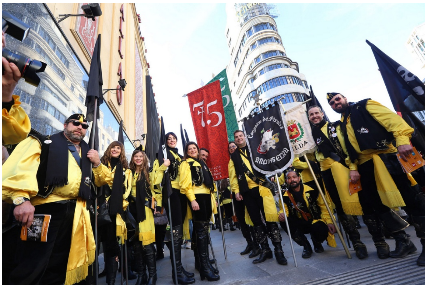
La marea pirata representó la reconquista cristiana por las calles de Madrid | Jesús Cruces.

Festeros de Elda representaron ayer con orgullo e ilusión a los Moros y Cristianos así como a las Fallas en el desfile organizado por el patronato Costa Blanca en Madrid con motivo de la feria FITUR. El pasacalles recorrió desde Plaza de Callao hasta la Plaza de Ópera, pasando por la misma Puerta del Sol y la calle Preciados , en un marco inmejorable para que los eldenses se luciesen al máximo. Las fiestas de la ciudad despertaron los aplausos de los madrileños y visitantes a lo largo de los 650 metros del recorrido al demostrar la pasión festera que derrocha la ciudad.