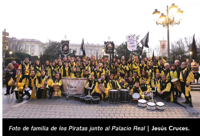
Foto de familia de los Piratas junto al Palacio Real | Jesús Cruces.

La alegría de los pasodobles cautivó a las miles de personas que se arremolinaron a lo largo del desfile, que amplió su recorrido en nada menos que 400 metros debido a la cantidad de público que acudió para conocer un aperitivo de cada una de las fiestas de la provincia . Llamaba la atención la gran cantidad de personas que reconocieron la fiesta eldense y aplaudían con ganas el paso de los Piratas.