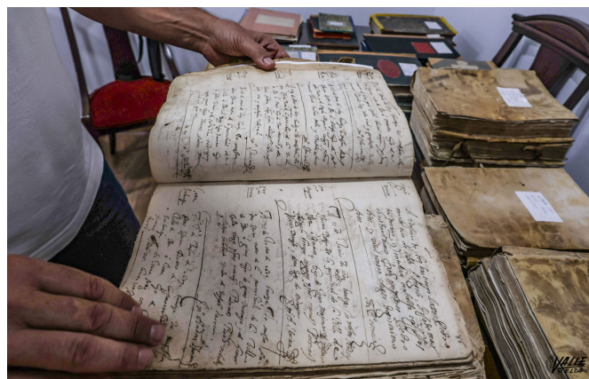
Estos libros recogen parte del pasado de Elda.

Y estos son solo algunos de los datos que permiten descubrir parte de la historia de la ciudad a través de estos importantes archivos .