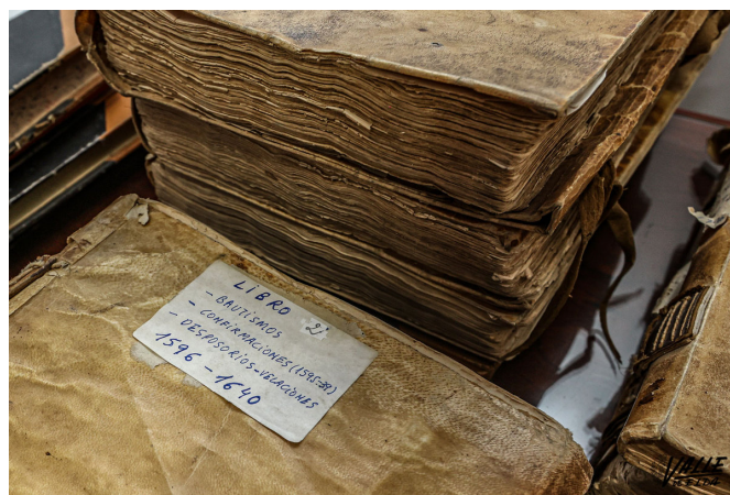
Algunos ejemplares tienen casi cinco siglos de antigüedad.