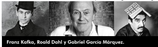
Franz Kafka, Roald Dahl y Gabriel García Márquez.

La forma de la espada , Jorge Luís Borges