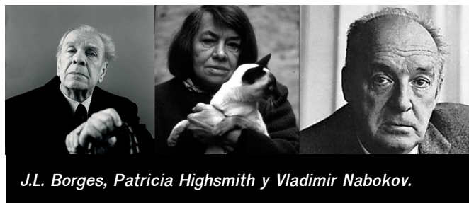
J.L. Borges, Patricia Highsmith y Vladimir Nabokov.

personajes que se nos presentan sin rodeos; escenarios evocadores, poéticos, sugerentes; un momento de acción o suspense que no presagia nada bueno; llamadas de atención sobre el propio relato para diferenciarlo del resto o la afirmación de un principio comúnmente aceptado para ser inmediatamente cuestionado , entre otras muchas estrategias. Léanlos, desentráñenlos y, por encima de todo, disfruten de algunos de los mejores inicios de una novela: