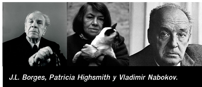
J.L. Borges, Patricia Highsmith y Vladimir Nabokov.

personajes que se nos presentan sin rodeos; escenarios evocadores, poéticos, sugerentes; un momento de acción o suspense que no presagia nada bueno; llamadas de atención sobre el propio relato para diferenciarlo del resto o la afirmación de un principio comúnmente aceptado para ser inmediatamente cuestionado , entre otras muchas estrategias. Léanlos, desentráñenlos y, por encima de todo, disfruten de algunos de los mejores inicios de una novela: