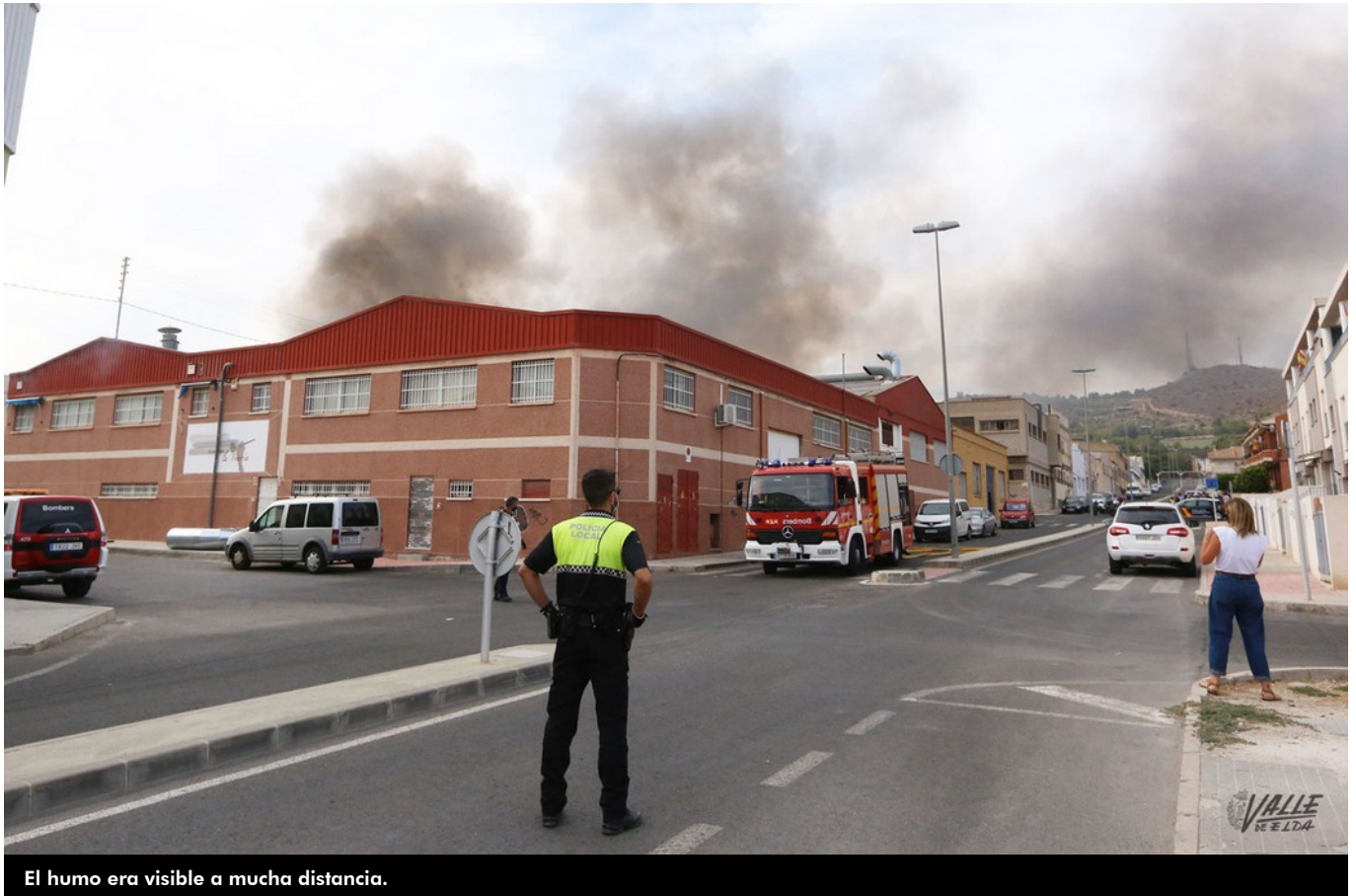
El humo era visible a mucha distancia.

Seis camiones de Bomberos y 14 miembros del cuerpo de Elda y Villena han acudido esta tarde a sofocar el incendio que se ha declarado en torno a las 17:25 horas en una fábrica de pieles del barrio La Torreña, situada en avenida de la Ermita.