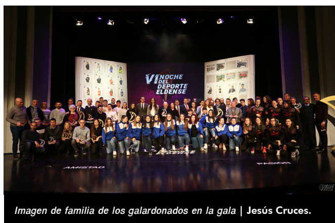
Imagen de familia de los galardonados en la gala