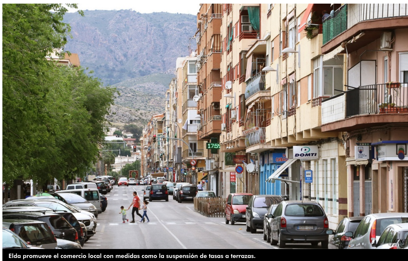
Elda promueve el comercio local con medidas como la suspensión de tasas a terrazas.

El Ayuntamiento de Elda ha celebrado un pleno telemático hoy en el que se han aprobado propuestas como la evaluación territorial para la construcción de un supermercado en el Sector 9 , la adhesión al protocolo marco del Programa Agente tutor , así como la suspensión provisional de las tasas de las terrazas a los bares y restaurantes . Este ha sido un pleno en el que ha reinado la cordialidad y en el que todos los políticos han votado a favor de las diferentes medidas.