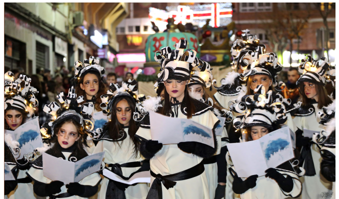
Un coro interpretó "Hecho con tus sueños" a viva voz derrochando talento | Jesús Cruces.

Durante más de 35 minutos los más pequeños dejaron a un lado los nervios por la llegada de los regalos para disfrutar al máximo del momento y no cesaron sonreír y señalarles a sus padres todos los detalles de la Cabalgata.