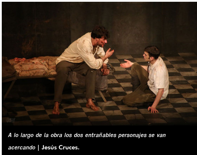
A lo largo de la obra los dos entrañables personajes se van acercando