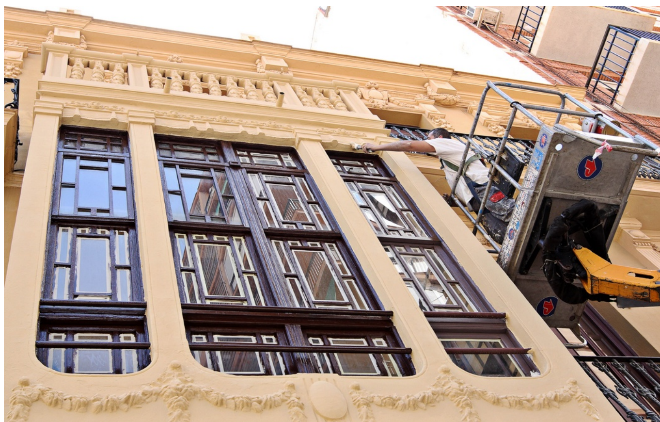
Trabajadores realizan obras en la Casa de la Viuda de Rosas

La Junta Central de Comparsas de Moros y Cristianos está realizando unas reparaciones en su sede, la Casa de la Viuda de Rosas, de cara para las fiestas en honor a San Antón, que comenzarán oficialmente en seis días, el jueves 28 de mayo con la Entrada de Bandas de Música.