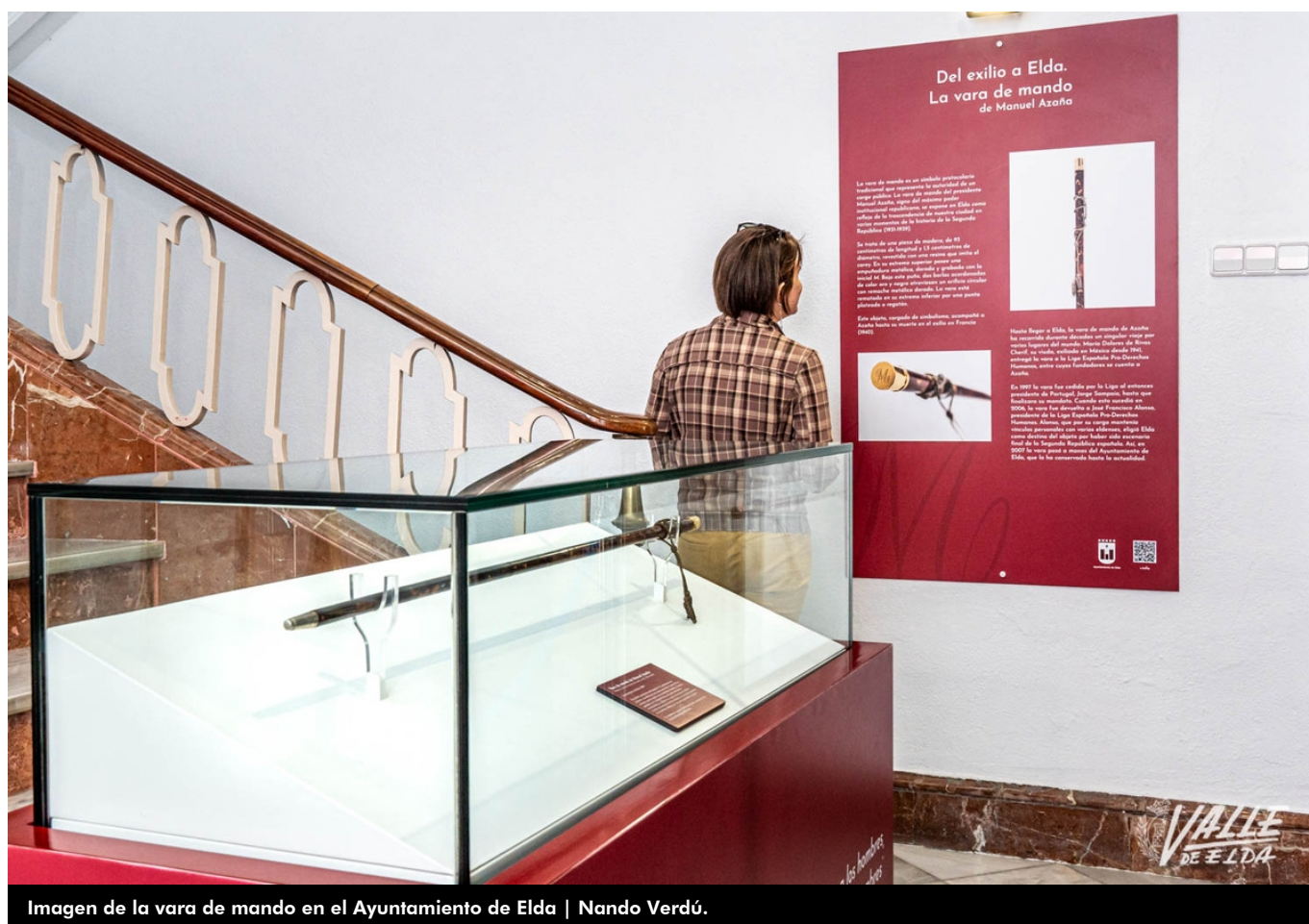
Imagen de la vara de mando en el Ayuntamiento de Elda | Nando Verdú.

Vox Elda ha presentado con carácter de urgencia una moción para que se incluya en el próximo pleno que tiene por objetivo defender la Ley de Concordia impulsada el gobierno de la Generalitat Valenciana de coalición PP-Vox. En su segunda parte pide al Ayuntamiento la retirada los símbolos de la historia reciente como la vara de mando del presidente de la Segunda República, Manuel Azaña . Este texto se ha registrado después de que el grupo Elda para Todas anunciase una moción en contra de la citada ley valenciana ya que se paraliza la exhumación de una fosa en Alicante donde se encuentran los restos de ocho