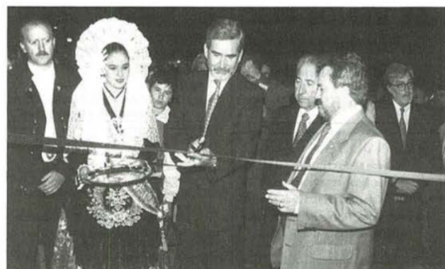
El presidente de la Generalidad, Juan Lerma, corta la cinta simbólica de la entrada principal al recinto de la Plaza Mayor, en presencia del alcalde, gerente de la empresa promotora de «Plaza Mayor», Fallera Mayor y presidente de las Fallas eldenses.

La ejecución del proyecto supuso la desaparición de además de edificios de fábricas y talleres, dispuestos en caótica ordenación urbanística, de dos emblemáticos espacios del ocio eldense durante décadas: el Cinema Coliseo y el Cine Alcázar . Pérdida que fue compensada por la ganancia del que con el paso del tiempo se ha convertido en el gran espacio público eldense por antonomasia.