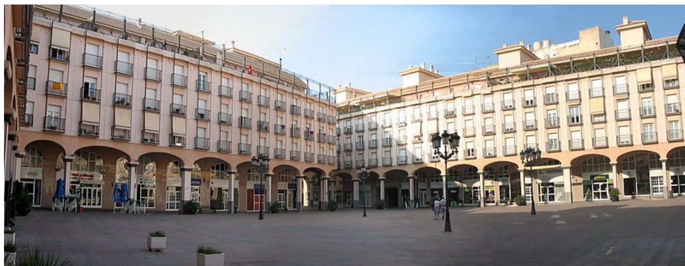
Panorámica de la Plaza Mayor de Elda. Autor. José Manuel Pérez. 8 de julio de 2006.

La Plaza Mayor de Elda acaba de cumplir 25 años. Fue un viernes, 28 de octubre de 1994, cuando Joan Lerma Blasco, presidente de la Generalitat Valenciana , procedía al corte simbólico de la cinta que inauguraba una de las actuaciones urbanísticas más ambiciosas de Elda, tanto por su magnitud como por su trascendencia social para todos los eldenses.