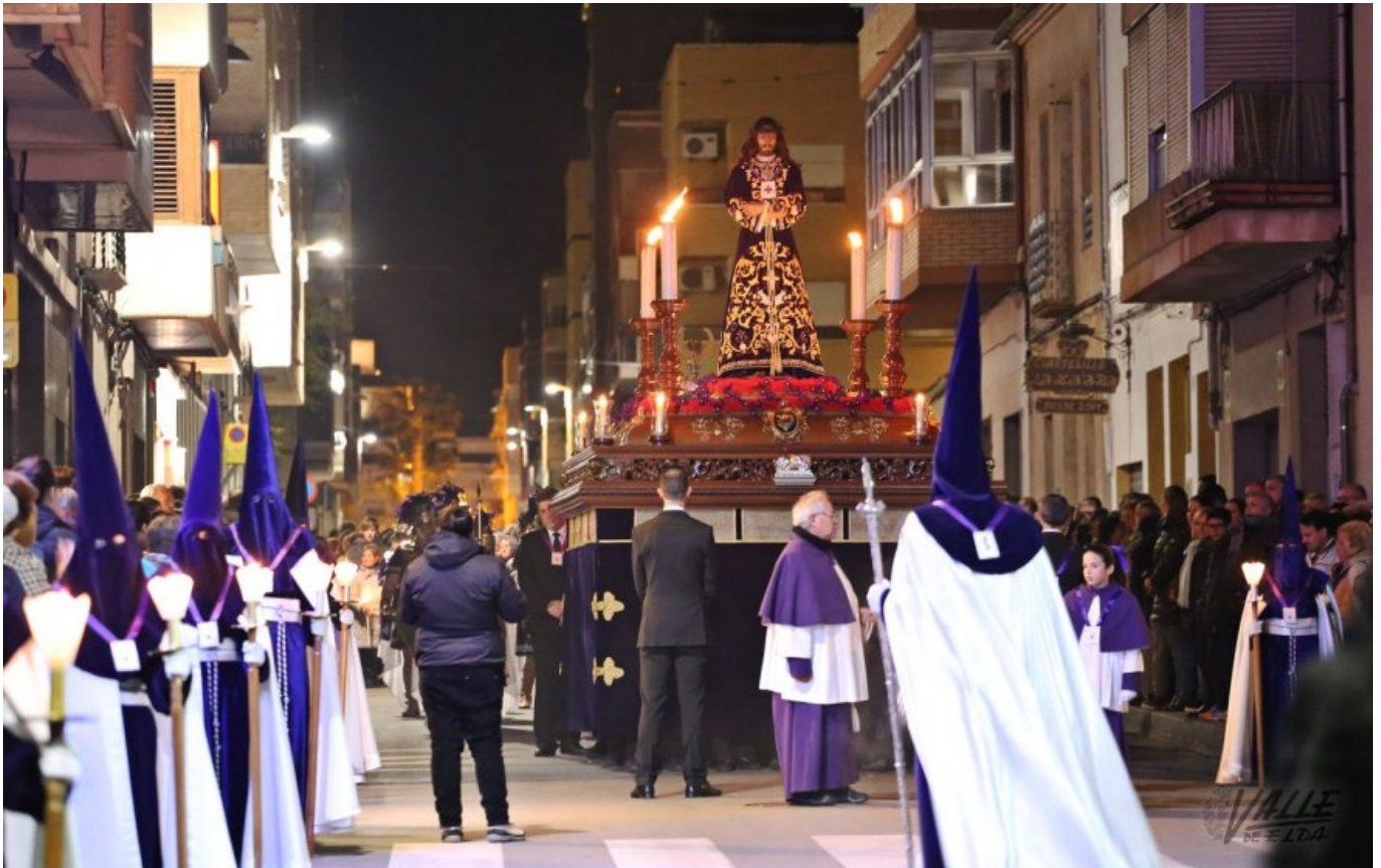
Las calles se llenaron para arropar a Jesús de Medinaceli | Jesús Cruces.