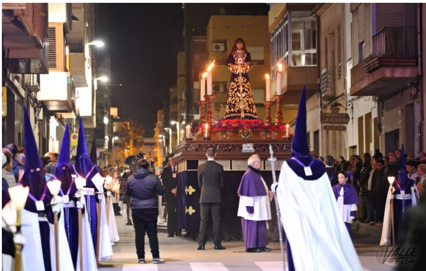
Las calles se llenaron para arropar a Jesús de Medinaceli | Jesús Cruces.