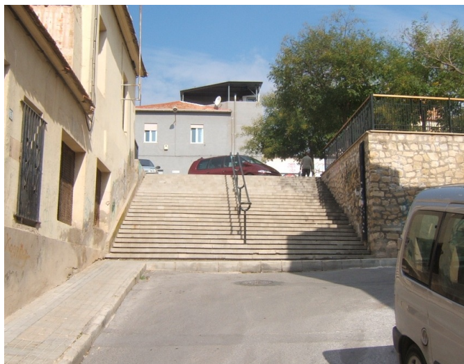
Vista del lugar donde se encontraba la boca de acceso al refugio antiaéreo del Altico de San Miguel.

Por la documentación sabemos que los refugios públicos fueron construidos en diversos lugares de la población, caso de las plazas de la Constitución y plaza de Arriba , enlazados por una galería capaz de albergar a 750 personas. Otro cerca del Matadero, por debajo del Altico de San Miguel que tenía una boca de salida en la Tafalera . Otro que se abría en la calle López de Vega , junto a Jardines, para dar servicio al Teatro Castelar . Y,