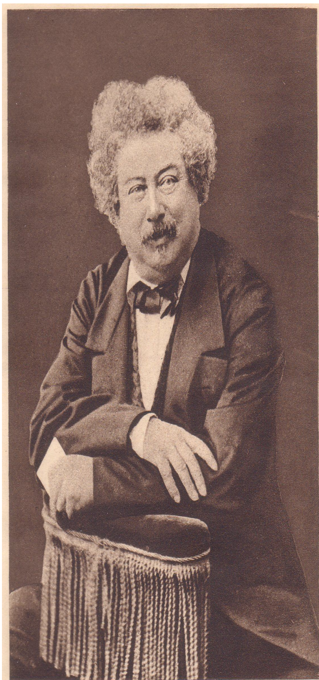
Alejandro Dumas padre tuvo 76 "negros" literarios

Tampoco esta es una actividad exclusiva de la literatura. Bien avanzado su arte, Picasso tenía vendidos sus cuadros antes de pintarlos y Dalí dejó firmados en blanco unos quinientos lienzos que fueron falsificaciones que costó mucho desenmascarar. Por no hablar de los guionistas de importantes presentadores (el poeta Javier Salvago para Jesús Quintero) o ¿cuántos políticos han escrito algún discurso en su vida? Incluso ya hay empresas que se ofrecen para escribir un libro por encargo. ¿Cuántos bestsellers pertenecen al autor que figura en la portada?