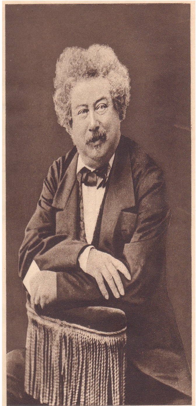
Alejandro Dumas padre tuvo 76 "negros" literarios

Tampoco esta es una actividad exclusiva de la literatura. Bien avanzado su arte, Picasso tenía vendidos sus cuadros antes de pintarlos y Dalí dejó firmados en blanco unos quinientos lienzos que fueron falsificaciones que costó mucho desenmascarar. Por no hablar de los guionistas de importantes presentadores (el poeta Javier Salvago para Jesús Quintero) o ¿cuántos políticos han escrito algún discurso en su vida? Incluso ya hay empresas que se ofrecen para escribir un libro por encargo. ¿Cuántos bestsellers pertenecen al autor que figura en la portada?