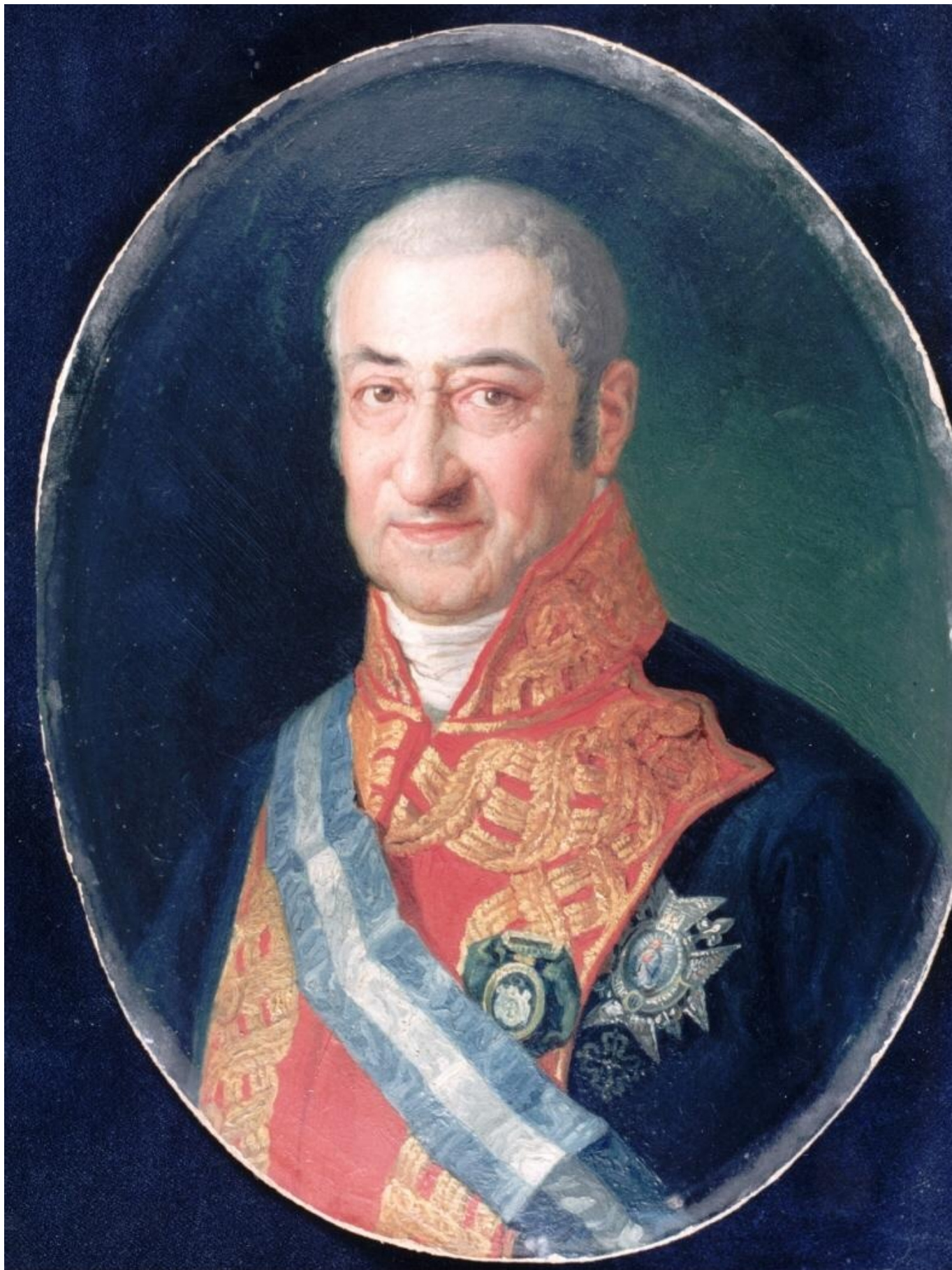
Felipe Carlos Osorio y Castelví, conde de Cervellón, Elda y Anna.