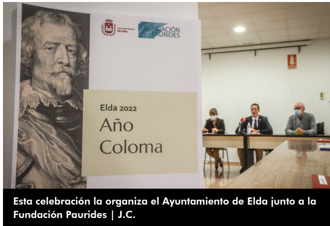
Esta celebración la organiza el Ayuntamiento de Elda junto a la Fundación Paurides