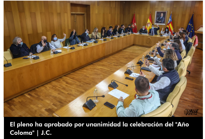
El pleno ha aprobado por unanimidad la celebración del "Año Coloma" | J.C.

Durante el pleno también se ha aprobado por unanimidad una moción del PSOE para solicitar que mejoren las conexiones por tren de la ciudad así como que se mantenga la atención personal en la estación ferroviaria y la propuesta de Ciudadanos para crear una comisión informativa para valorar una revisión catastral y la posible reducción del IBI en la ciudad.