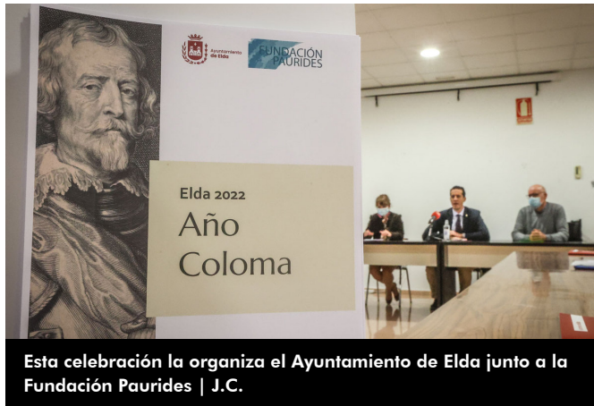
Esta celebración la organiza el Ayuntamiento de Elda junto a la Fundación Paurides