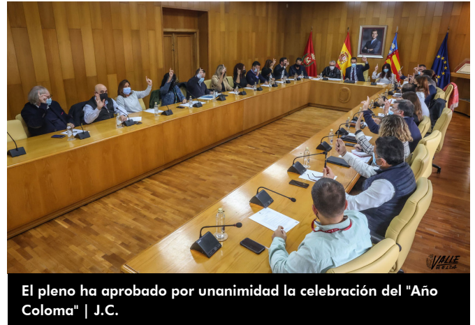
El pleno ha aprobado por unanimidad la celebración del "Año Coloma"

Durante el pleno también se ha aprobado por unanimidad una moción del PSOE para solicitar que mejoren las conexiones por tren de la ciudad así como que se mantenga la atención personal en la estación ferroviaria y la propuesta de Ciudadanos para crear una comisión informativa para valorar una revisión catastral y la posible reducción del IBI en la ciudad.