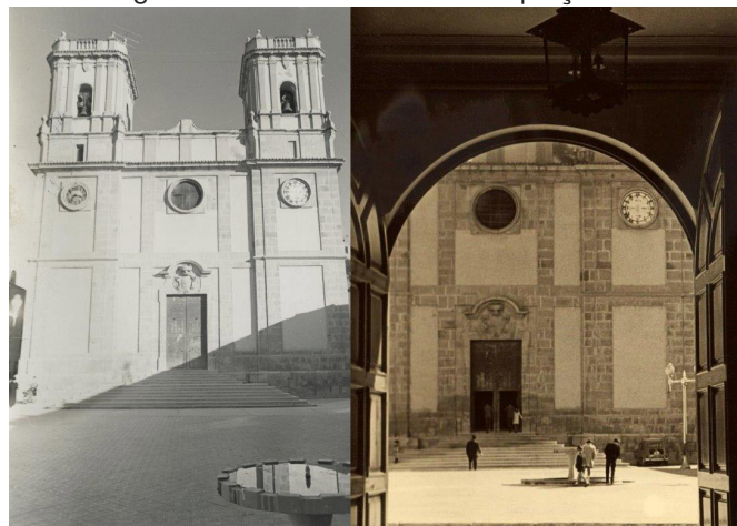
Quan es van llevar les graderies de l'església la font de proveïment d'aigua va ser substituïda per una font decorativa.

mosaic romà. Ara ens toca esperar a veure els resultats de les excavacions arqueològiques i comprovar si torna a cantar l'aigua en la nostra emblemàtica plaça.