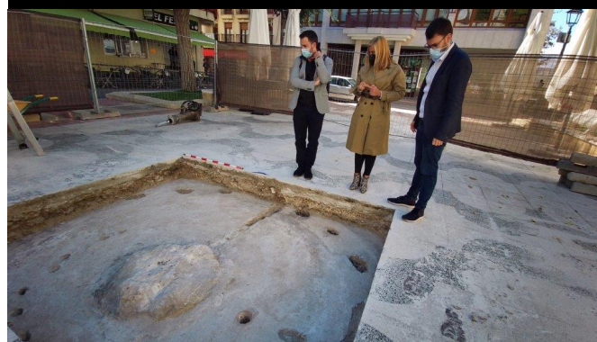
En novembre de 2021 durant els treballs arqueològics va eixir a la llum la peanya de l'antiga font d'aigua que presidia la plaça de Baix.