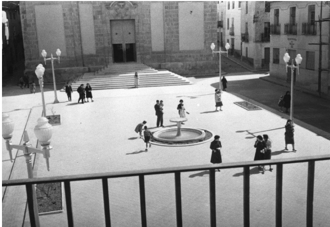
La font vista des de l'Ajuntament | Vicente Villaplana.

En l'obra de l'escriptor Azorín hi ha contínues referències a este element urbà. L'escriptor monover escriu en la seua novel·la Antonio Azorín (1903) referent a esta plaça i la seua font: "Hay una plaza grande, callada, con una fuente en medio y en el fondo una iglesia. La fuente es redonda; tiene en el centro del pilón una columna que sostiene una taza; de la taza chorrea por cuatro caños perennemente el agua. La iglesia es de piedra blanca; la flaquean dos torres achatadas; se asciende a ella por dos espaciosas y divergentes escaleras. Es una bella fuente que susurra armoniosa; es una bella iglesia que se destaca serena en el azul diáfano. Las golondrinas giran y pían en torno de las torres; el agua de la fuente murmura placentera".