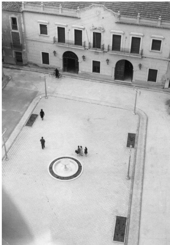
La plaça des de el campanari de l'església | Vicente Villaplana.

En 1784 Bernardo Espinalt fa referència a la font que ens ocupa: "... la Iglesia es muy antigua y chica, por cuya causa se está construyendo una nueva de buena arquitectura en la plaza principal, en medio de la qual hay una hermosa fuente...". La construcció devia estar relacionada amb l'ampliació i remodelació de la plaça, ja que hem de tenir en compte que es va derruir un bloc de cases que va canviar per complet la fisonomia. També Pascual Madoz, en 1849, parla de les fonts de la plaça de la Constitució i una altra "llamada de Arriba (es referix a la de la plaça de Dalt), de cuyas ricas y abundantes aguas se surte el vecindario".