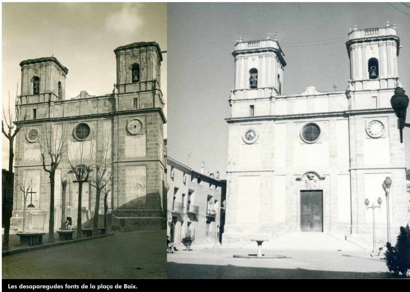
Les desaparegudes fonts de la plaça de Baix.