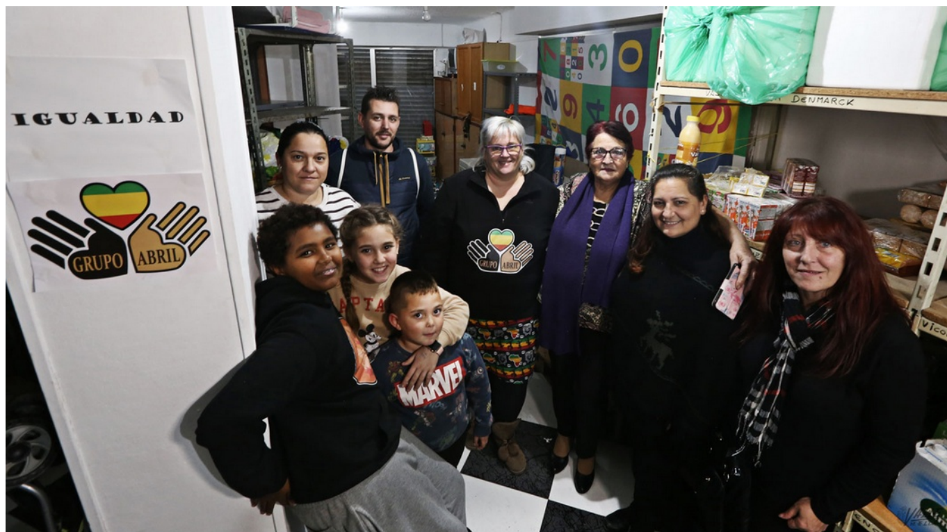
El Grupo Abril da una muestra más de solidaridad celebrando la Nochebuena | Jesús Cruces.

El Grupo Abril continúa creciendo y trabajando por el bien de las personas en riesgo de exclusión social de Elda y Petrer . Esta gran familia solidaria da un paso más y esta Navidad ha organizado una cena de Nochebuena a la que asistirán 45 personas de ambos municipios, una forma de pasar una noche divertida y feliz para esas personas que iban a pasar solos la noche o aquellas familias que no podían hacer frente al coste de la celebración. Contarán con productos de calidad donados por empresas solidarias.