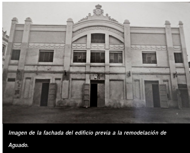
Imagen de la fachada del edificio previa a la remodelación de Aguado.

Durante los años que dirigió el Castelar, decidió transformar el teatro circo que era por aquel entonces en un teatro cine , eliminó los palcos de la planta inferior y añadió cientos de butacas, con lo que consiguió un aforo de unas 1.200 personas. Además, amplió el edificio y lo dotó del actual vestíbulo . Esta reforma permitió hacer de las proyecciones de cine todo un éxito, pues en el Castelar se pudieron ver miles de películas.