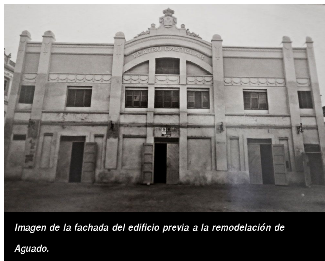
Imagen de la fachada del edificio previa a la remodelación de Aguado.

Durante los años que dirigió el Castelar, decidió transformar el teatro circo que era por aquel entonces en un teatro cine , eliminó los palcos de la planta inferior y añadió cientos de butacas, con lo que consiguió un aforo de unas 1.200 personas. Además, amplió el edificio y lo dotó del actual vestíbulo . Esta reforma permitió hacer de las proyecciones de cine todo un éxito, pues en el Castelar se pudieron ver miles de películas.