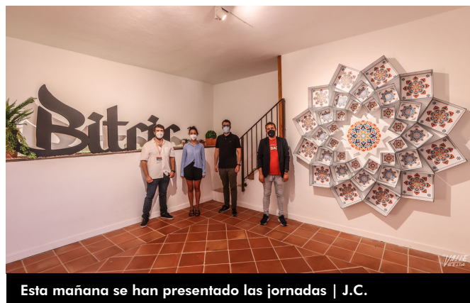
Esta mañana se han presentado las jornadas

Esta tarde comienza la tercera edición de Art al Balcó , que se inaugura esta tarde, a las 19 horas, en la Plaça de Baix , y cuyas obras colgarán de los balcones del centro histórico hasta el 10 de octubre. Durante los días 18 y 19, a las 12 horas y saliendo de la plaça de Baix, se realizarán rutas guiadas por componentes de la Asociación "la Casica del Artista".