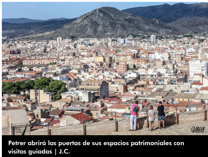
Petrer abrirá las puertas de sus espacios patrimoniales con visitas guiadas | J.C.

El sábado y el domingo se mostrará el Petrer medieval en el Castillo con una actividad con 3D. El sábado 18, de 11 a 13 horas , en la explanada del Castillo habrá una exhibición de espadas a modo de entrenamiento realizado por el grupo de esgrima "El arte del duelo" de Elda . El mismo día, a las 20 horas , en la sala noble del castillo, tendrá lugar la representación de la obra de teatro "Joanot" de Joan Nave, bajo la dirección de Joanmi Reig , única actividad de las jornadas que no es gratuita y para la que se pueden comprar las entradas en las taquillas del Teatro Cervantes, el martes y jueves de 18:30 a 20:30 horas -