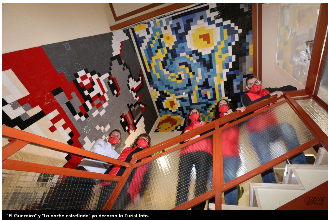
"El Guernica" y "La noche estrellada" ya decoran la Turist Info.