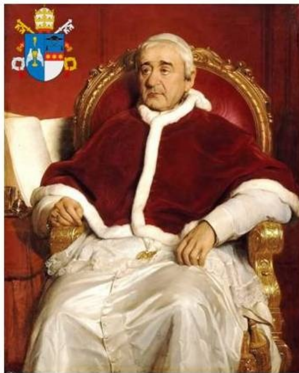
Gregorio XVI (1831-1846)

A lo largo de sus casi 500 años de historia, la iglesia parroquial de Santa Ana , de Elda, ha gozado de un buen número de privilegios eclesiásticos temporales unos y perpetuos otros, para uso y disfrute de los fieles.