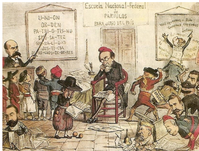
Caricatura de la revista satírica La Flaca en la que aparece Pi y Margall desbordado por el federalismo, representado por figuras infantiles ataviadas con los distintos trajes regionales, mientras Castelar intenta poner orden instruyendo a los alumnos.

Salmerón, al recibir la orden del capitán general, suspendió la votación y comunicó lo que estaba sucediendo. Seguidamente intervinieron varios diputados para protestar por la acción de Pavía pero entonces fuerzas de la Guardia Civil y del Ejército entraron en el edificio del Congreso disparando tiros al aire por los pasillos y los diputados lo abandonaron rápidamente.