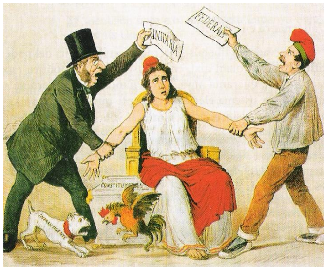
Caricatura de la revista satírica La Flaca del 3 de marzo de 1873 sobre la pugna entre los unitarios, que defienden la república unitaria, representados por Emilio Castelar (derecha) y los republicanos federales que defienden la federal, representados por José M a Orensé (izquierda). Y también sobre la feroz pugna entre los federales "transigentes" e "intransigentes" | Dominio Público.

objetivo acabar con la rebelión cantonal de Cartagena y con la 3ª guerra civil carlista , que amenazaba a extenderse a toda España. Así, durante 3 meses suspendió las garantías constitucionales, estableció la censura de prensa y reorganizó el cuerpo de artillería disuelto bajo el reinado de Amadeo de Saboya ; llamó a los reservistas y convocó una nueva leva con la que consiguió un ejército de 200.000 hombres, además de un empréstito de 100 millones de pesetas para hacer frente a los gastos de la guerra. Como él mismo definió "...necesito mucha infantería, mucha caballería, mucha artillería, mucha Guardia Civil y muchos carabineros" para sostener y defender a la República.