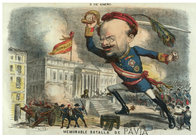
Caricatura de los sucesos del 3 de enero de 1874 en los que el general Pavía acude en auxilio de Emilio Castelar, preso de los republicanos federales, aparecida en La Madeja Política.

El mismo Emilio Castelar, quién días atrás había rehusado el apoyo de las armas que le ofreció el general Pavía para mantenerse en el poder, publicó el mismo día 3 de enero una protesta contra las espadas militares y las bayonetas federales, acusándoles de haber acabado con la República.