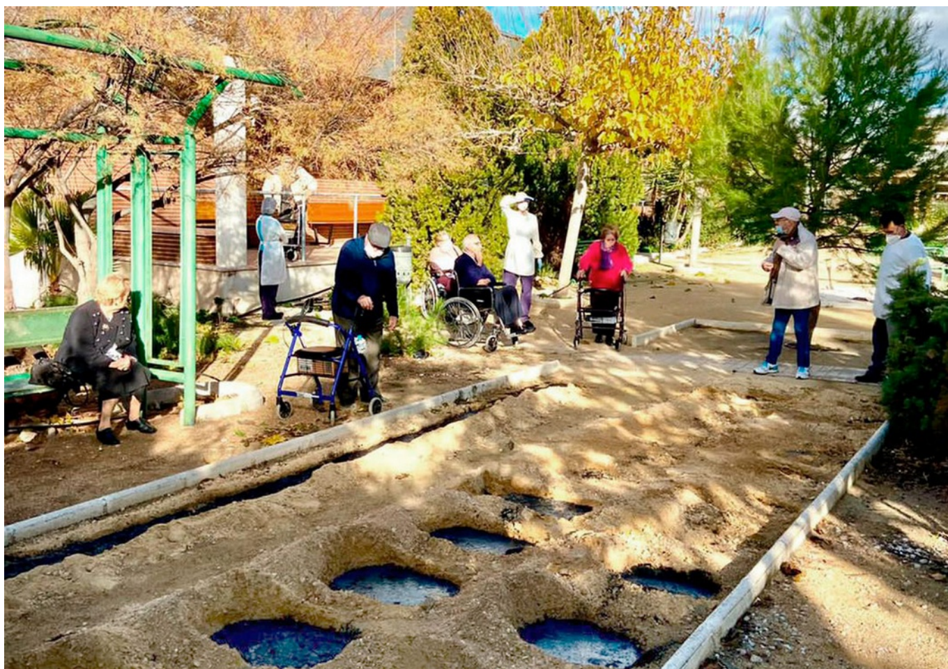
Los usuarios disfrutaban cuidando este huerto mediano.

La residencia La Molineta de Petrer ha puesto en marcha su propio huerto para que los usuarios disfruten de la naturaleza y un nuevo entretenimiento en esta época en la que apenas pueden hacer actividades a causa de las medidas de seguridad por la COVID-19. Es una forma de que pasen tiempo al aire libre con actividades que les gustan.