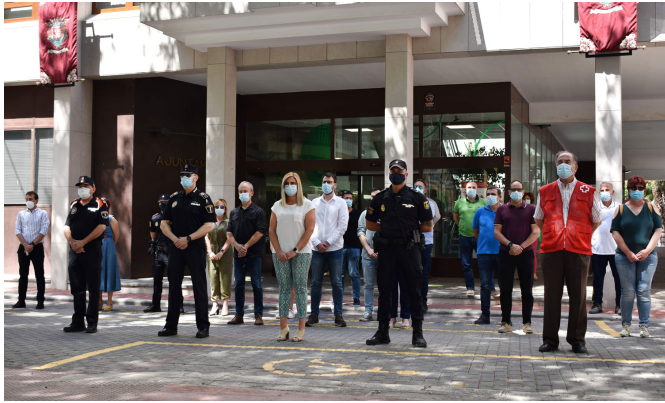
Minuto de silencio en Petrer.