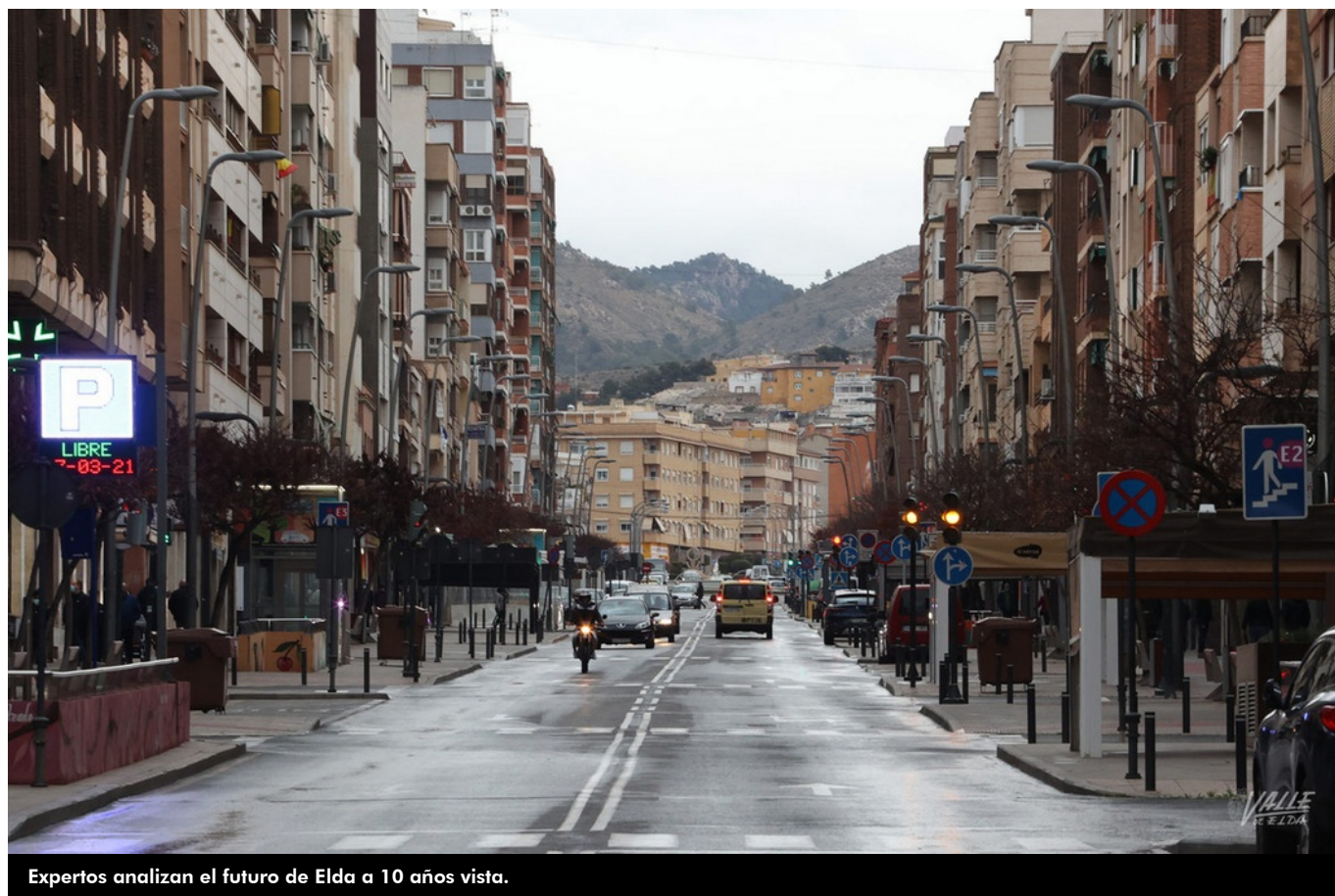
Expertos analizan el futuro de Elda a 10 años vista.

Políticos, empresarios y expertos en urbanismo, historia, geografía, medio ambiente, comercio, industria y servicios han aportado sus ideas y conocimientos a la hora de analizar los retos que tienen que afrontar las poblaciones de Elda y Petrer durante los próximos diez años. Todos ellos tienen en cuenta que nos encontramos en plena crisis por el coronavirus, en la era digital y tecnológica, conscientes por ello de la necesidad de emprender proyectos innovadores que permitan a la ciudadanía superar los estragos de una pandemia mundial.