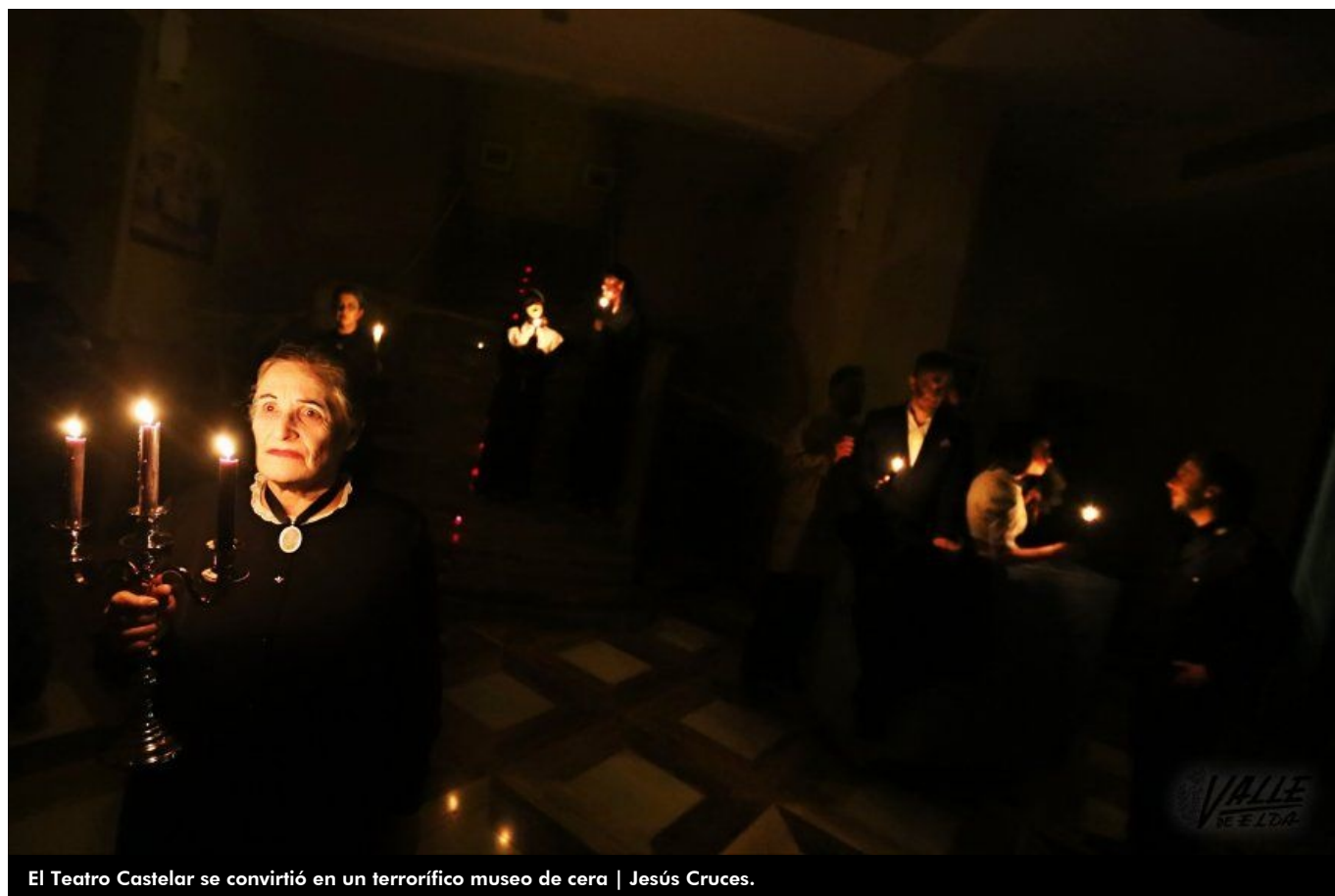
El Teatro Castelar se convirtió en un terrorífico museo de cera

Miles de vampiros, brujas, zombis y todo tipo de monstruos tomaron las calles de Elda y Petrer para celebrar Halloween, una tradición pagana que llegó hace unos años y que cada 31 de octubre consigue consolidarse un poco más. La iniciaron los más pequeños, pero ya participan en Halloween jóvenes y adultos celebrando fiestas privadas, el tradicional truco o trato y las actividades organizadas por las concejalías de Juventud de ambas localidades, que permitieron a los ciudadanos disfrutar de una terrorífica y divertida noche.