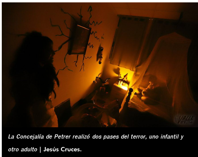
La Concejalía de Petrer realizó dos pases del terror, uno infantil y otro adulto | Jesús Cruces.

En Petrer niños y mayores pudieron visitar la mansión de la señora Fasegura , una tétrica estancia en la que cada rincón de la Concejalía de Juventud albergaba distintos terrores , donde cientos de personas asistieron al pasaje del terror en dos pases, uno para niños y otro para adultos. La excelente caracterización y actuación de cada uno de los actores que participaron en esta obra consiguieron aterrar al público, que se desplazó a lo largo de las estancias, agrupados y mirando hacia cada rincón con risa nerviosa. Además los actores realizaron bailes a las puertas de la concejalía.