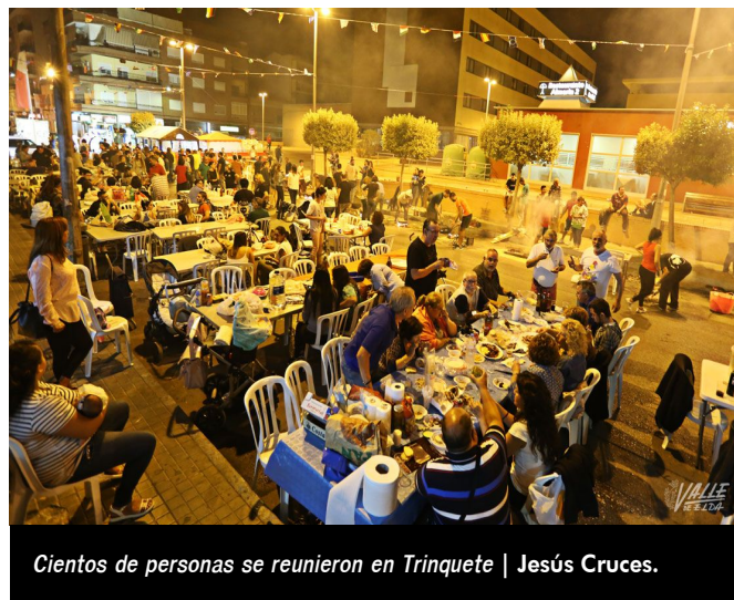
Cientos de personas se reunieron en Trinquete | Jesús Cruces.

Tras la entrega de premios la Cabalgata del Ninot partirá desde la Plaza del Ayuntamiento hasta la Plaza Castelar, en la que se podrán ver los ninots indultados . Este año por votación popular han ganado el Ninot infantil de Falla Fraternidad , obra del artista Francisco José Conejero y en la categoría adulta el ninot de la Falla Fraternidad obra de los artistas Sierra-Conejero.