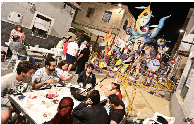
Cientos de personas se reunieron en Fraternidad | Jesús Cruces.

Los artistas se esforzaron al máximo para que sus piezas de arte estuviesen perfectas para recibir al jurado calificador , que ha comenzado la visita de los diferentes monumentos desde primera hora de la mañana.