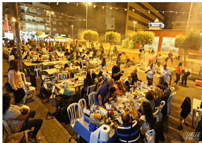
Cientos de personas se reunieron en Trinquete | Jesús Cruces.

Tras la entrega de premios la Cabalgata del Ninot partirá desde la Plaza del Ayuntamiento hasta la Plaza Castelar, en la que se podrán ver los ninots indultados . Este año por votación popular han ganado el Ninot infantil de Falla Fraternidad , obra del artista Francisco José Conejero y en la categoría adulta el ninot de la Falla Fraternidad obra de los artistas Sierra-Conejero.