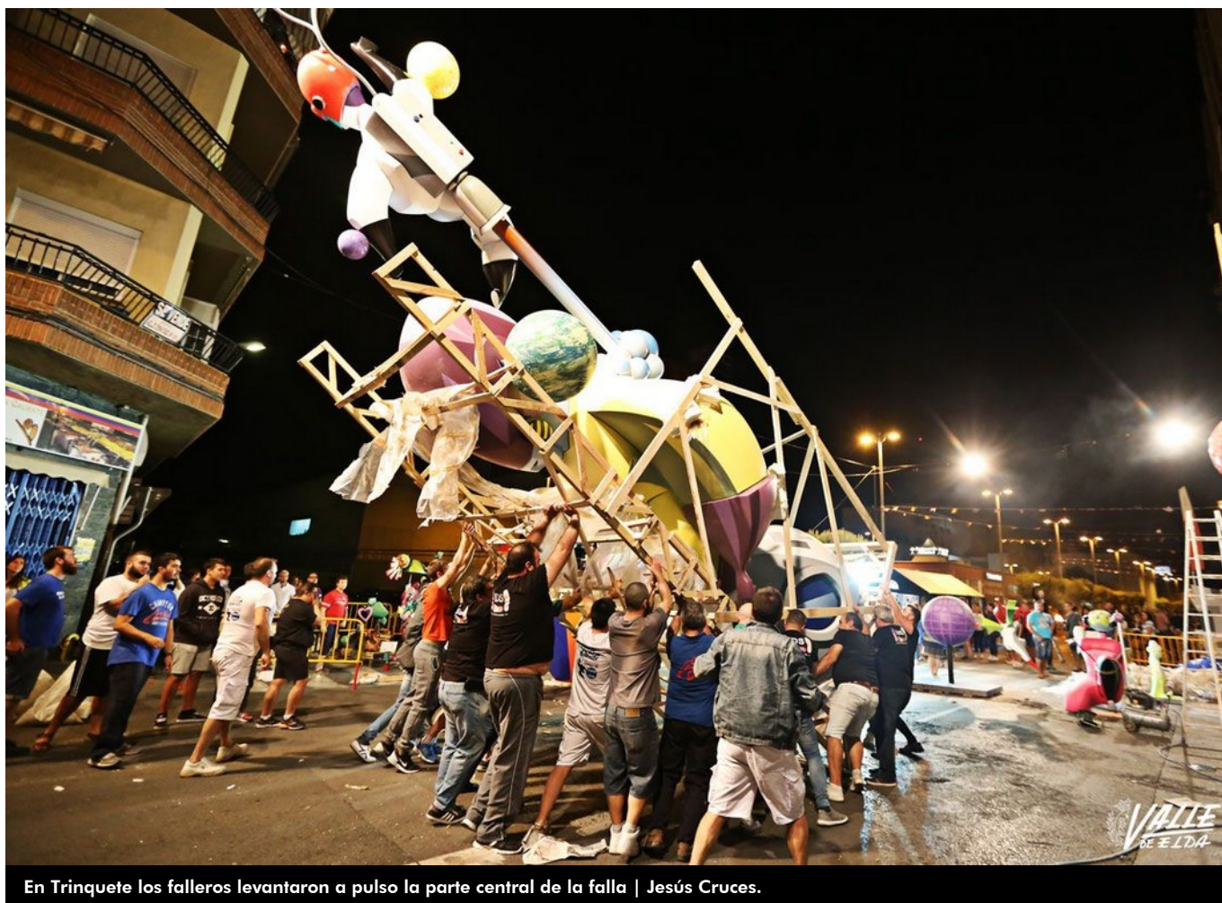
En Trinquete los falleros levantaron a pulso la parte central de la falla | Jesús Cruces.

La noche del jueves de Fallas trajo consigo la tradición y cientos de personas salieron a las calles de Elda para disfrutar de la Plantá, uno de los actos más esperados por los festeros . Mientras los camiones que cargaban los monumentos iban llegando a la ciudad, los falleros se reunieron con amigos y familiares para cenar las típicas gachamigas. Las estructuras falleras fueron tomando forma conforme el reloj avanzaba hasta lucir imponentes, listas y a la espera de la llegada de los primeros rayos de sol para que se puedan visitar los monumentos infantiles y adultos desde primera hora del día.