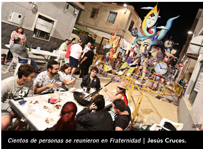
Cientos de personas se reunieron en Fraternidad | Jesús Cruces.

Los artistas se esforzaron al máximo para que sus piezas de arte estuviesen perfectas para recibir al jurado calificador , que ha comenzado la visita de los diferentes monumentos desde primera hora de la mañana.