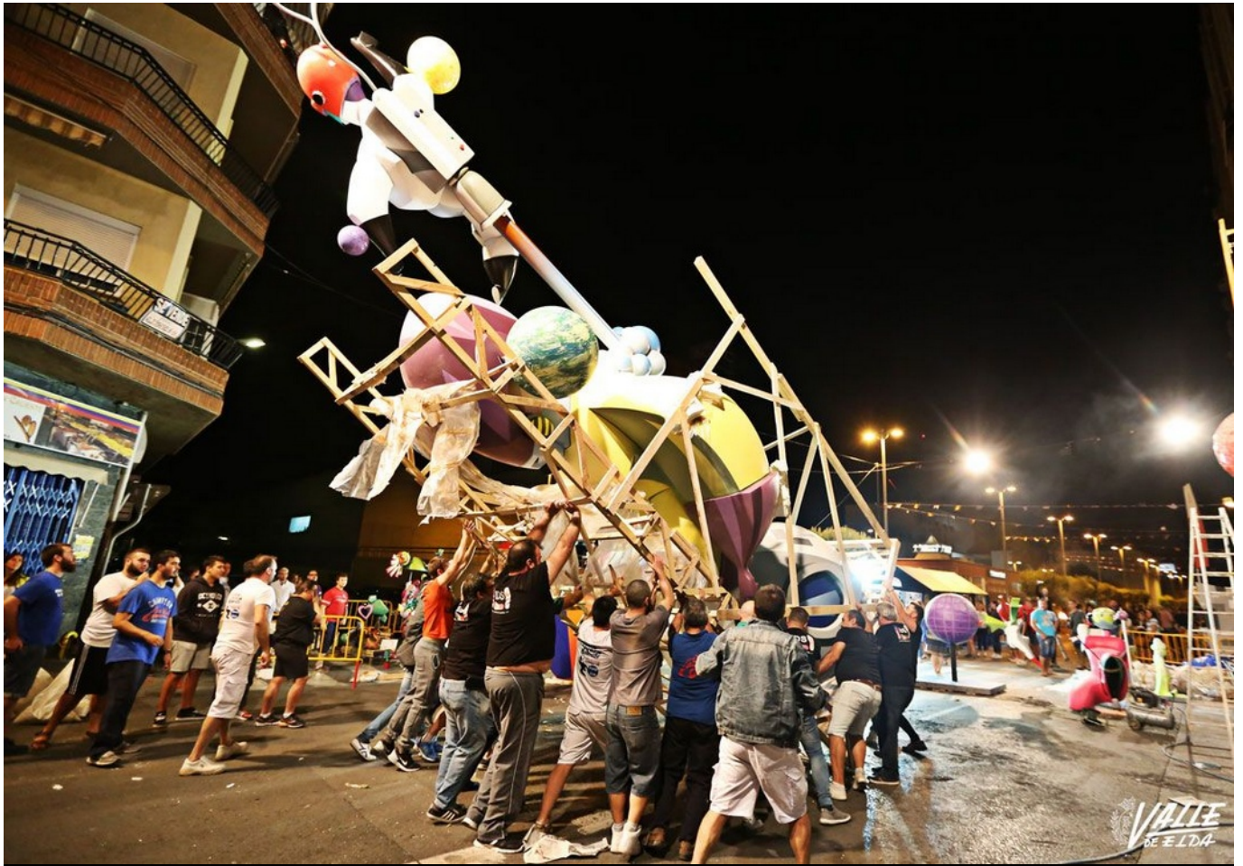
En Trinquete los falleros levantaron a pulso la parte central de la falla | Jesús Cruces.

La noche del jueves de Fallas trajo consigo la tradición y cientos de personas salieron a las calles de Elda para disfrutar de la Plantá, uno de los actos más esperados por los festeros . Mientras los camiones que cargaban los monumentos iban llegando a la ciudad, los falleros se reunieron con amigos y familiares para cenar las típicas gachamigas. Las estructuras falleras fueron tomando forma conforme el reloj avanzaba hasta lucir imponentes, listas y a la espera de la llegada de los primeros rayos de sol para que se puedan visitar los monumentos infantiles y adultos desde primera hora del día.