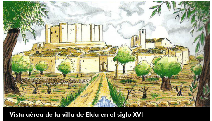
Vista aérea de la villa de Elda en el siglo XVI

Tiempo durante el cual los destinos de Elda, Petrer y Salinas caminaron unidos . Vínculo jurídico y territorial que todavía hoy podemos rastrear en numerosos lazos culturales, sociales, religiosos y festivos vinculados al señorío de los Coloma y al condado de Elda.