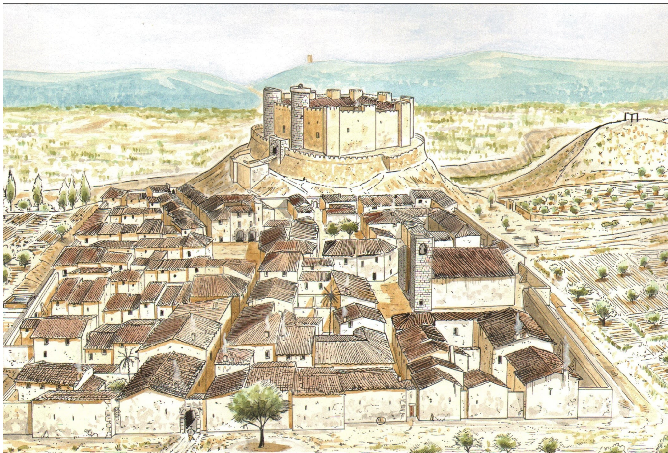
Vista de la villa de Elda en el siglo XVI