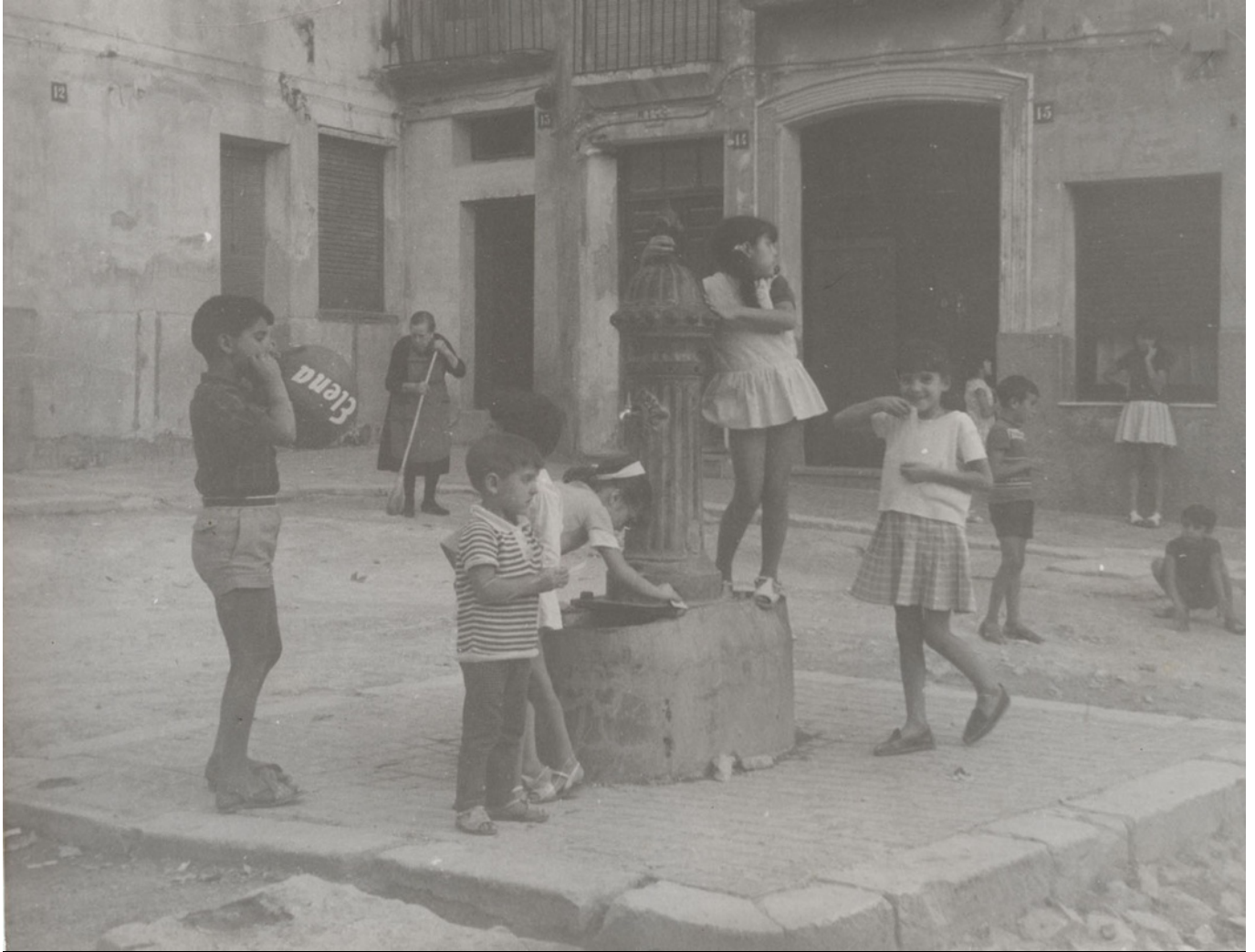
La fuente de la plaza de Dalt era la misma que había en la calle Gabriel Brotons. Barriendo la calle Plácida Díaz Beltrán. Esta fotografía se presentó a un concurso del Club de la Juventud con el lema: Ellos juegan. Años 60.