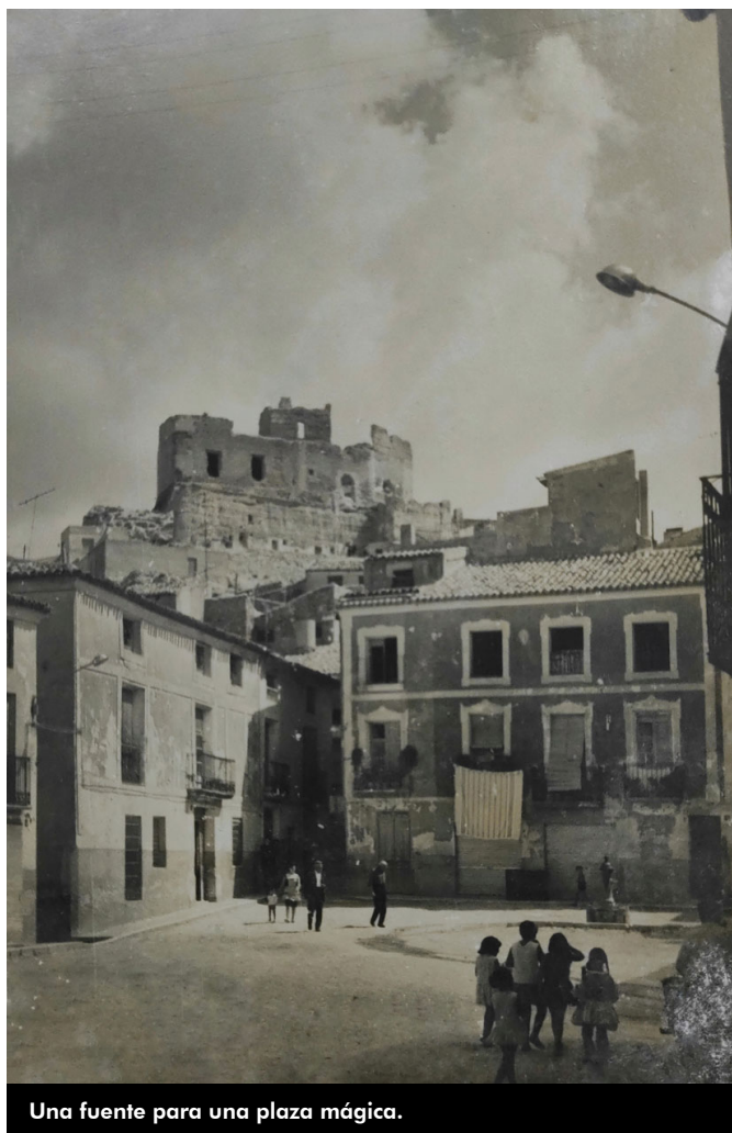
Una fuente para una plaza mágica.