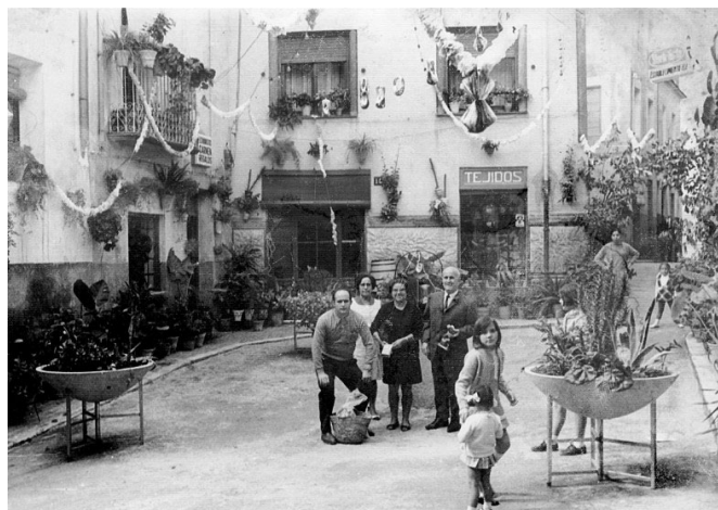
La placeta donde estaba la fuente de San Bartolomé, conocida popularmente como la placeta de Vera, forma parte de la calle Gabriel Brotóns. Al fondo la calle Tetuán. 7-X-1969.

Cresolet la teua llum i el teu record són eterns.