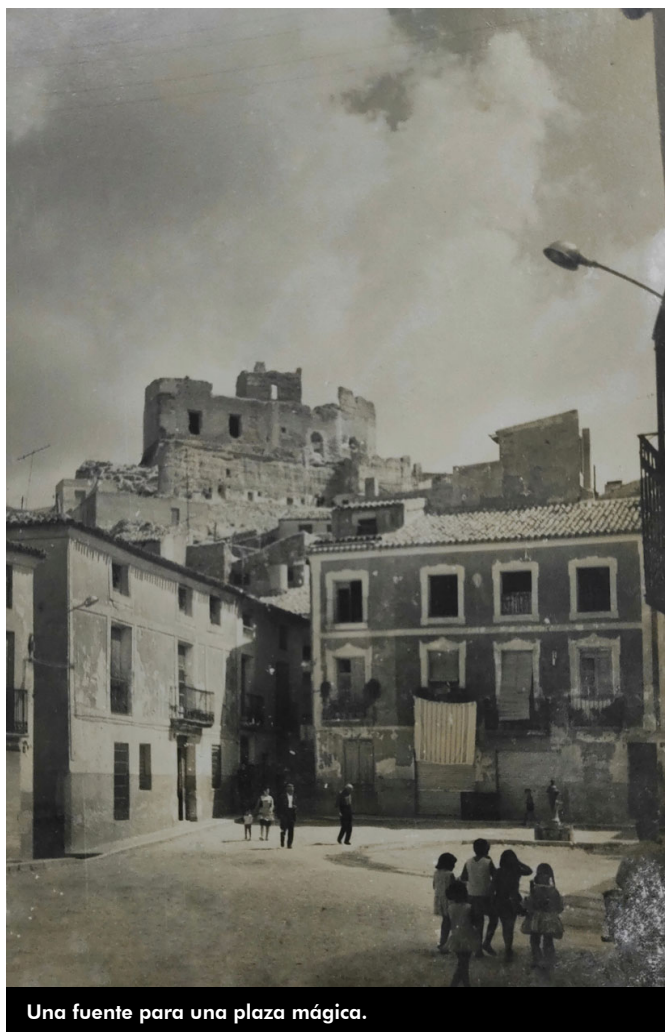
Una fuente para una plaza mágica.