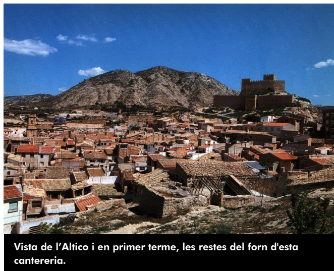
Vista de l'Altico i en primer terme, les restes del forn d'esta cantereria.