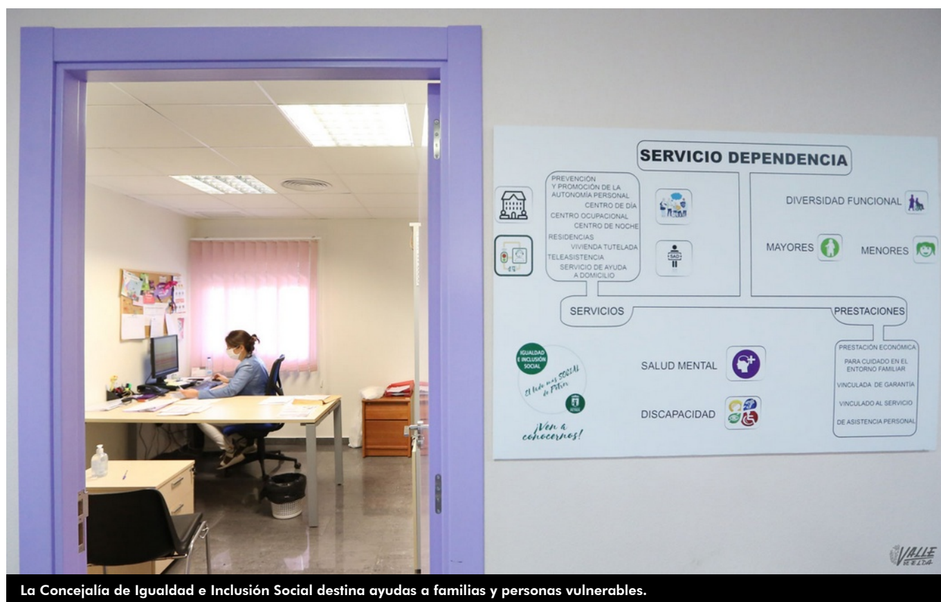
La Concejalía de Igualdad e Inclusión Social destina ayudas a familias y personas vulnerables.

La Concejalía de Igualdad e Inclusión Social de Petrer ha gestionado un total de 535 ayudas con un valor de 107.000 euros desde que se decretó el estado de alarma. También confirman desde la concejalía que en los meses de abril y mayo han sido 310 familias las que se han beneficiado de ayudas de emergencia en alimentación y vivienda con una inversión de 70.000 euros.