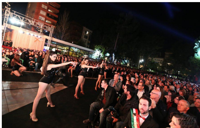
Cerca de 2.000 personas se reunieron en la Plaza Castelar para asistir a este evento festero | Jesús Cruces.

cruz. En la gala también se presentó la edición número 72 de la revista MyC 2016.