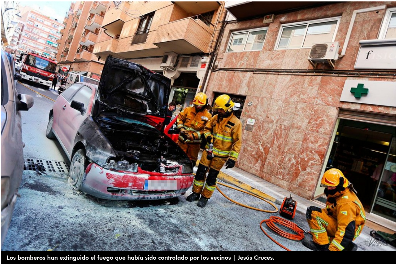
Los bomberos han extinguido el fuego que había sido controlado por los vecinos | Jesús Cruces.

La calle José María Pemán ha permanecido cortada al tráfico durante al menos una hora a las 13:30 h del sábado cuando una conductora se ha visto sorprendida por el incendio del motor de su vehículo mientras circulaba por el centro de Elda. El incendio ha bloqueado la vía en hora punta, pues no se ha podido mover el coche hasta que el fuego no se ha dado por extinguido. Un gran número de personas se arremolinó alrededor del coche incendiado.