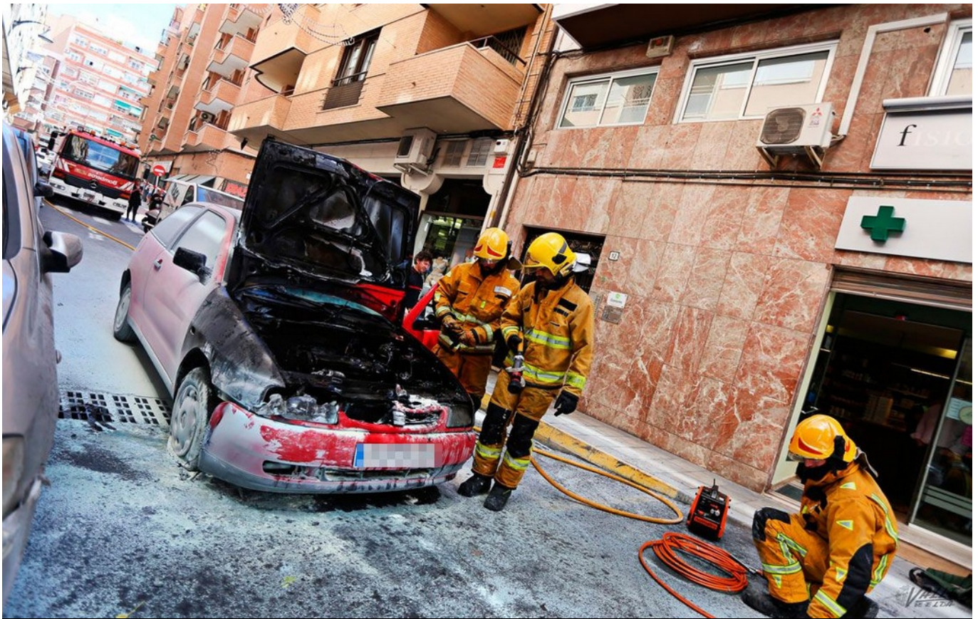
Los bomberos han extinguido el fuego que había sido controlado por los vecinos

La calle José María Pemán ha permanecido cortada al tráfico durante al menos una hora a las 13:30 h del sábado cuando una conductora se ha visto sorprendida por el incendio del motor de su vehículo mientras circulaba por el centro de Elda. El incendio ha bloqueado la vía en hora punta, pues no se ha podido mover el coche hasta que el fuego no se ha dado por extinguido. Un gran número de personas se arremolinó alrededor del coche incendiado.