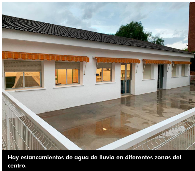
Hay estancamientos de agua de lluvia en diferentes zonas del centro.