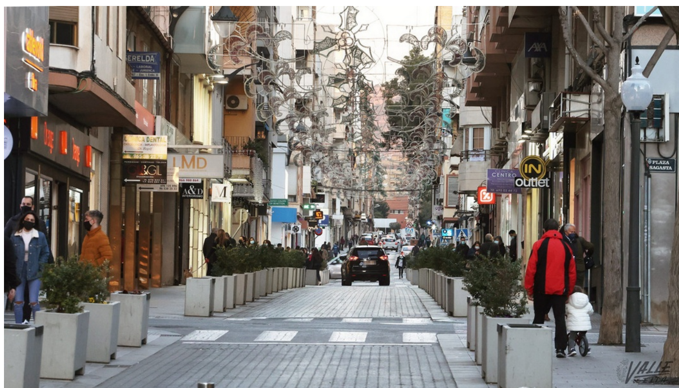
Los comercios cerrarán a las 18 horas a partir del jueves.

El nuevo paquete de medidas de la Comunidad Valenciana para frenar la curva de contagios que en esta tercera ola está disparada incluye el cierre total de la hostelería . El resto de comercios tendrán que hacerlo a las 18 horas, salvo los negocios esenciales, que mantendrán su horario habitual. Las medidas estarán en vigor a partir del jueves a las 00 horas durante 15 días.