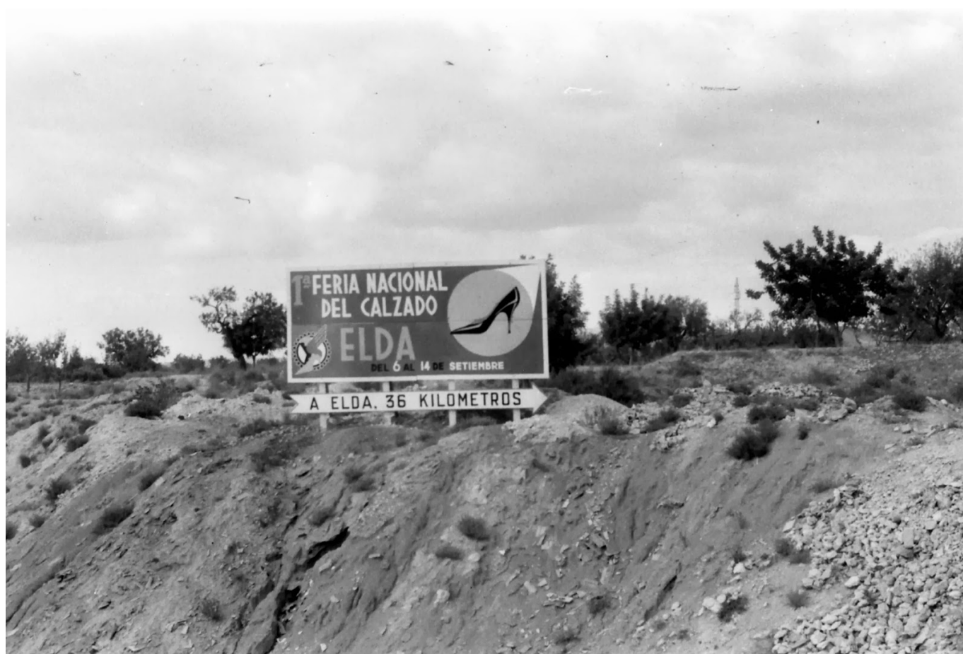
Emotivo y esperanzador cartel anunciador de las Ferias del Calzado de Elda.

Como todos los inicios de algún acontecimiento importante el "boca a boca" juega un papel muy importante, pero se precisan otras voluntades que ayuden a fraguar una idea.