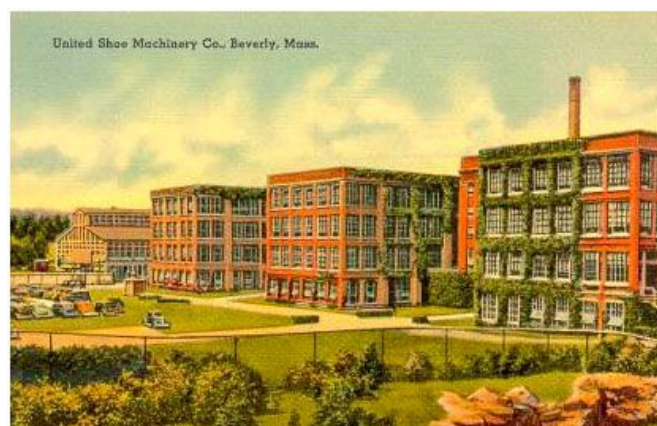
Naves industriales de la factoría de la UNITED en Beverly, EE.UU.

Para evitarse competencias de otras industrias muy