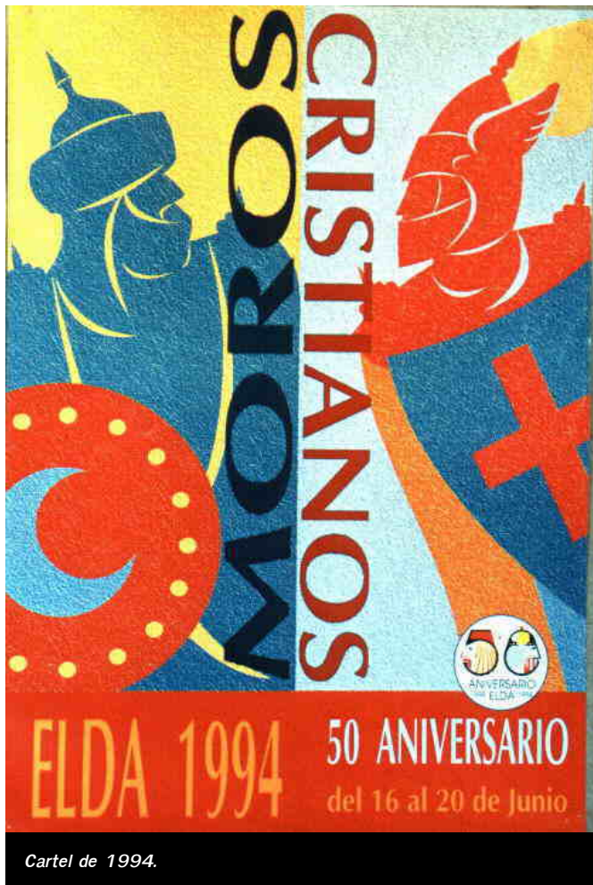
Cartel de 1994.

Desde estas líneas queremos desear una larga vida a este concurso porque es un factor artístico y cultural que prestigia a nuestra Fiesta, se intenta que el fallo final sea verdaderamente participativo y democrático y, además,