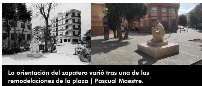
La orientación del zapatero varió tras una de las remodelaciones de la plaza