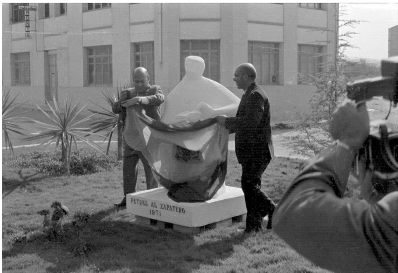
El monumento se inauguró el 31 de octubre de 1971 | Heliodoro Corbí.

En Petrer no tenemos muchas esculturas significativas dignas de resaltar. Pero hoy queremos referirnos a una que nos acompaña desde hace ahora 50 años y se dice pronto. Nos estamos refiriendo al monumento al zapatero de la plaza de San Crispín del que hasta hoy no conocíamos su historia pero que ha sido testigo de nuestros juegos y correrías por este singular espacio. Recuerdo perfectamente cuando se colocó y lo extraño e innovador que nos pareció en aquel momento este monumento que rinde homenaje al zapatero.