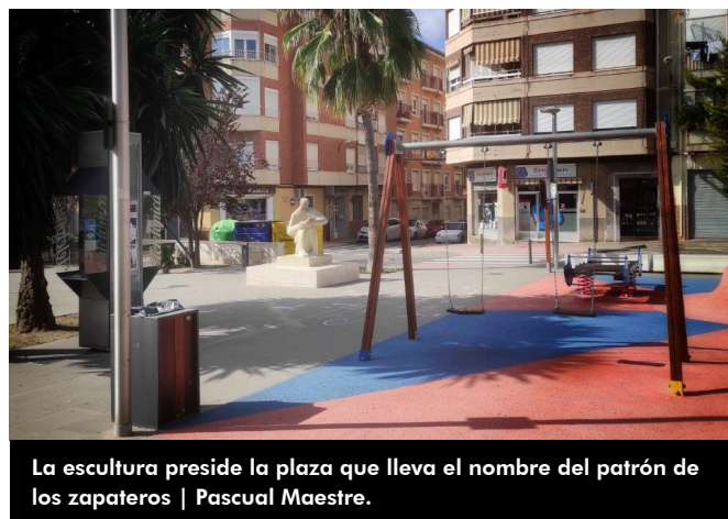
La escultura preside la plaza que lleva el nombre del patrón de los zapateros