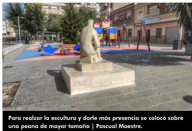
Para realzar la escultura y darle más presencia se colocó sobre una peana de mayor tamaño | Pascual Maestre.

En próximas crónicas haremos referencia a cómo se celebraba la festividad de San Crispín que incluía, entre otros actos, la edición de un programa de actos, misa en la ermita de San Bonifacio y procesión. Hasta entonces os invito a disfrutar de estas singulares imágenes.