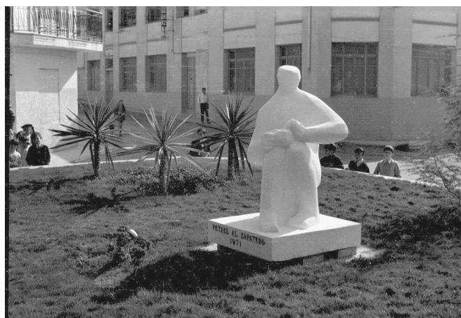
Los niños contemplan expectantes la escultura | Heliodoro

En Petrer no tenemos muchas esculturas significativas dignas de resaltar. Pero hoy queremos referirnos a una que nos acompaña desde hace ahora 50 años y se dice pronto. Nos estamos refiriendo al monumento al zapatero de la plaza de San Crispín del que hasta hoy no conocíamos su historia pero que ha sido testigo de nuestros juegos y correrías por este singular espacio. Recuerdo perfectamente cuando se colocó y lo extraño e innovador que nos pareció en aquel momento este monumento que rinde homenaje al zapatero.