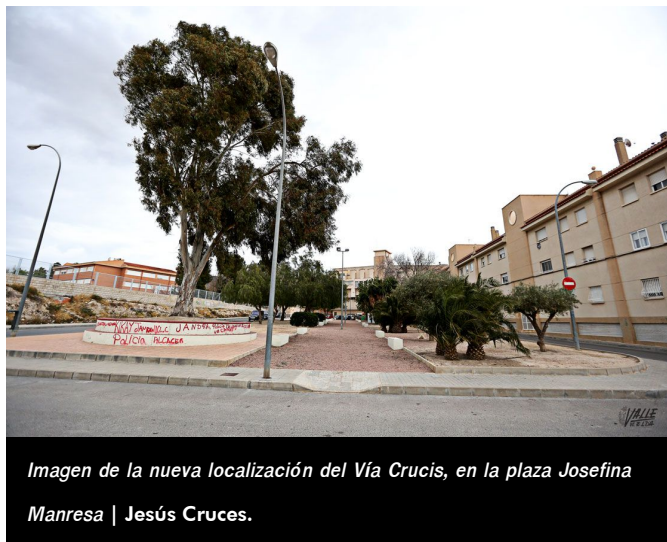
Imagen de la nueva localización del Vía Crucis, en la plaza Josefina Manresa | Jesús Cruces.

Según el informe negativo, el solar está ubicado en un antiguo depósito de agua que fue demolido y está en un avanzado estado de deterioro por lo que no cumple la normativa vigente para poder realizar actos públicos que congregan a un importante número de personas.