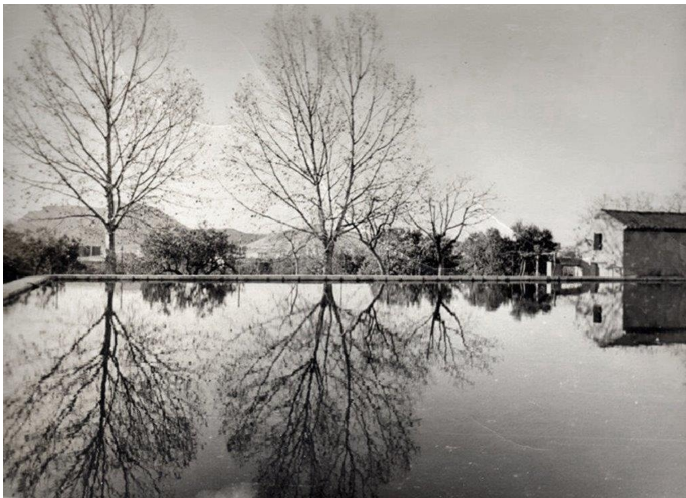
La Bassa Perico tenía una capacidad de 1.200 metros cúbicos | José Esteve.

El nombre de Bassa Perico nos evoca tiempos pasados. Esta balsa fue también conocida, aunque en menor medida, como la de los Cuatro Caminos en referencia al lugar donde se ubicó en el confluían la huerta que llegaba a la Casa Cortés, Salinetes, la Almafrá Baja y el casco urbano de Petrer. Antes, cuando la balsa tenía agua era punto de reunión de los regantes de la huerta. Bajo los plataneros los regantes cambiaban “les paraes”, esperaban “la tanda” o se fumaban algún que otro cigarro. Estaba ubicada en lo que hoy es parte del Colegio 9 d’Octubre y hasta los años 70 del pasado siglo este lugar constituyó un punto de encuentro de la gente