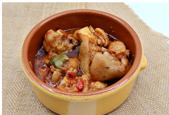
Manitas de cerdo en salsa.

Toda la información del negocio está disponible en www.manamenu.es .