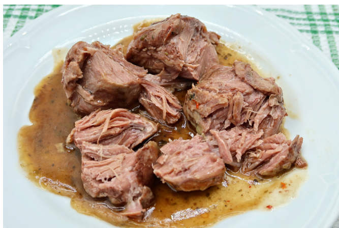
Carrillada de cerdo chumichurri.

Este comercio, situado en calle La Fuente, número 12, de Petrer, frente al Museo Dámaso Navarro, abrió sus puertas el pasado viernes y cuenta con una amplia carta de productos artesanales. Destaca el preparado de gazpachos manchegos y sus arroces variados, pero también cuentan con otros platos, como los tres tipos de pechugas, a la mostaza, a las finas hierbas y al limón. De la misma forma ofrecen costillar de cerdo con su Salsa Calorina, una salsa propia muy deliciosa solo para gratinar en el horno, carrilladas de cerdo y manitas de cerdo en salsa entre otros.