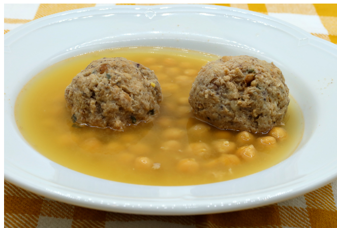
Faseguras de la Yaya Marisa.

ofrecer este tipo de comida basada en los alimentos de quinta gama, pero con cocina artesanal.